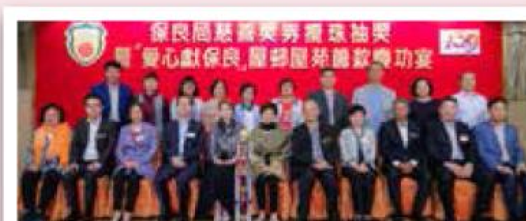
企業募捐大獎 香港東莞社團總會