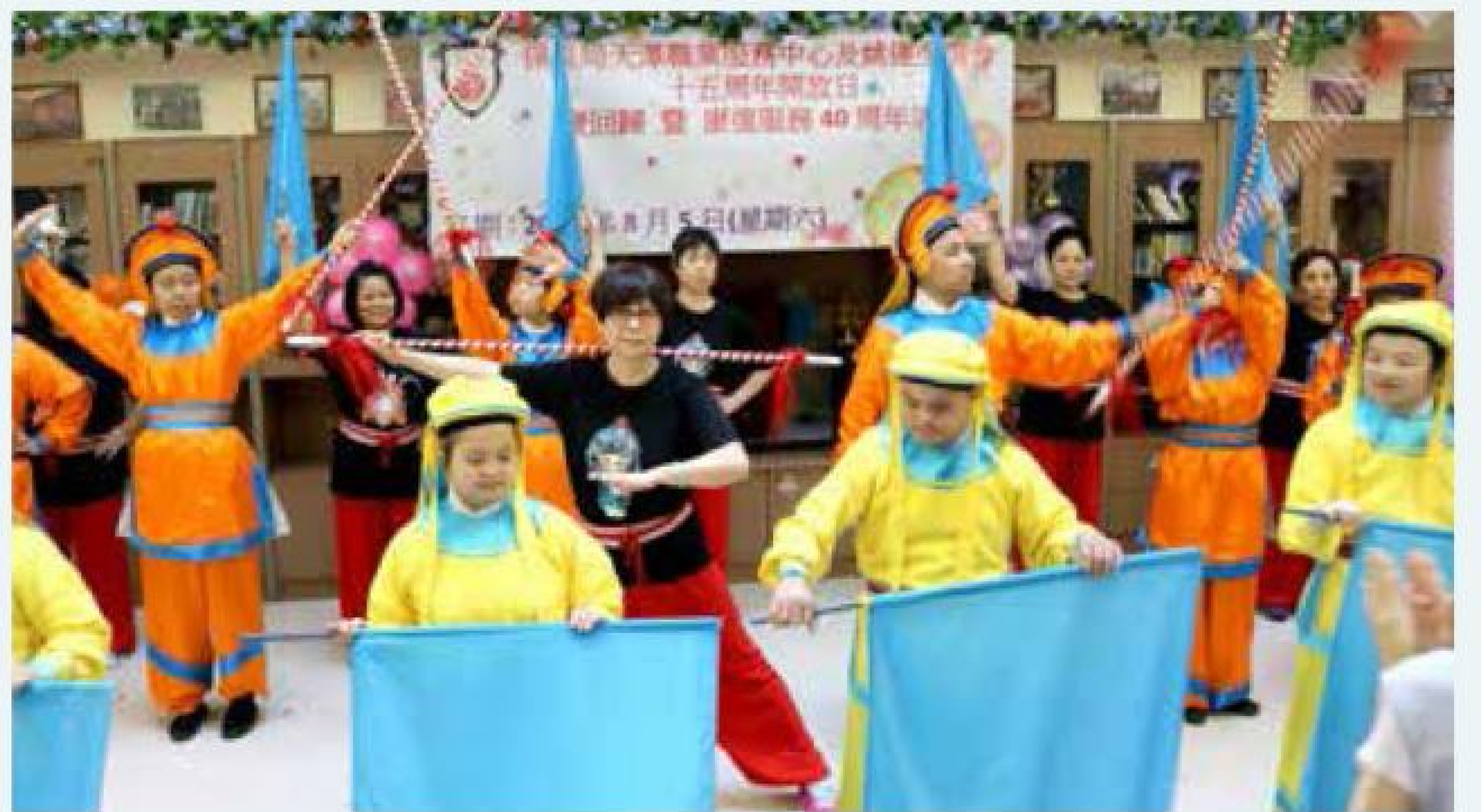
天澤職業服務中心及姚連生宿舍舉行十五周年開放日，同時是康復服務40周年活動起動禮。