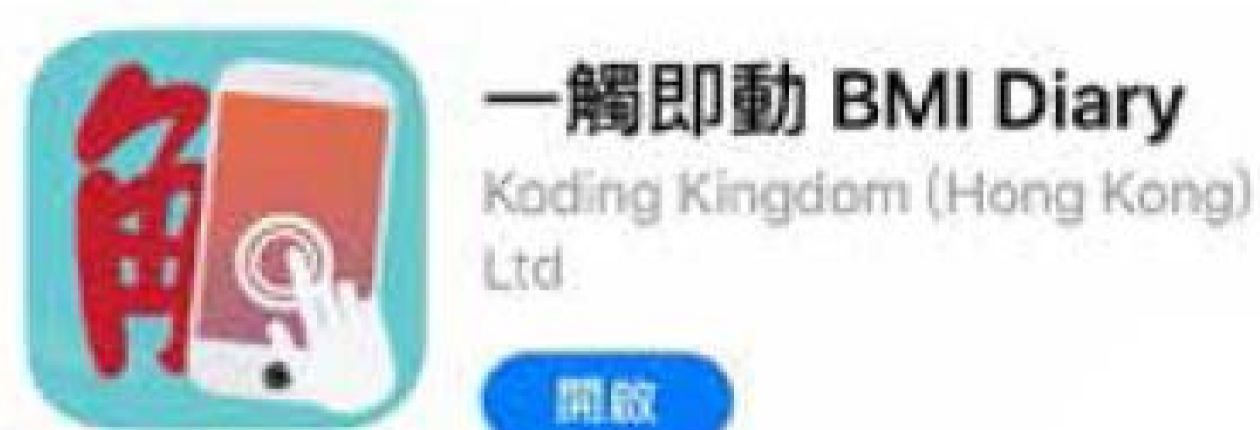
康寶萊聯同本局長康青少年發展中心推展免費手機應用程式「一觸即動」。

該手機應用程式包括 BMI 量度、健體操教學、健康飲食、營養食譜等，鼓勵年輕一代注重健康生活。