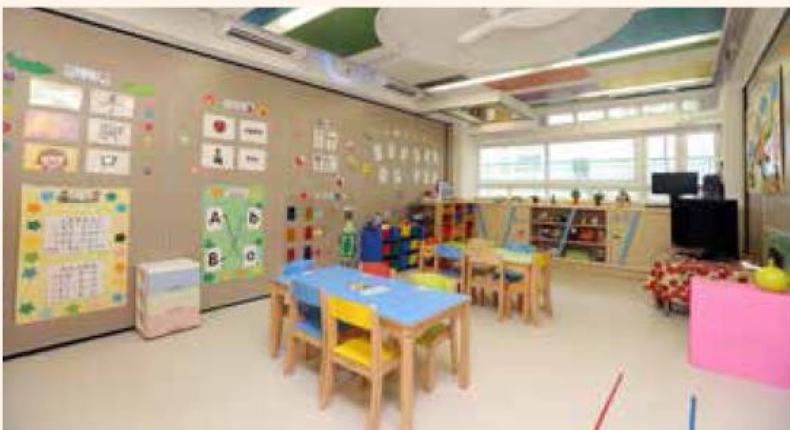
校舍預留近7千平方呎予學生活動，除課室外，還有各類特別室，助學生發展不同的才能。