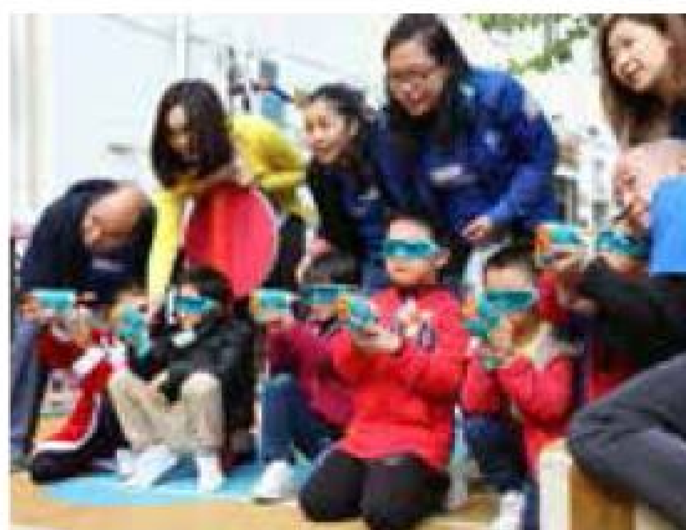
孩之寶遠東有限公司 Global Day of Joy