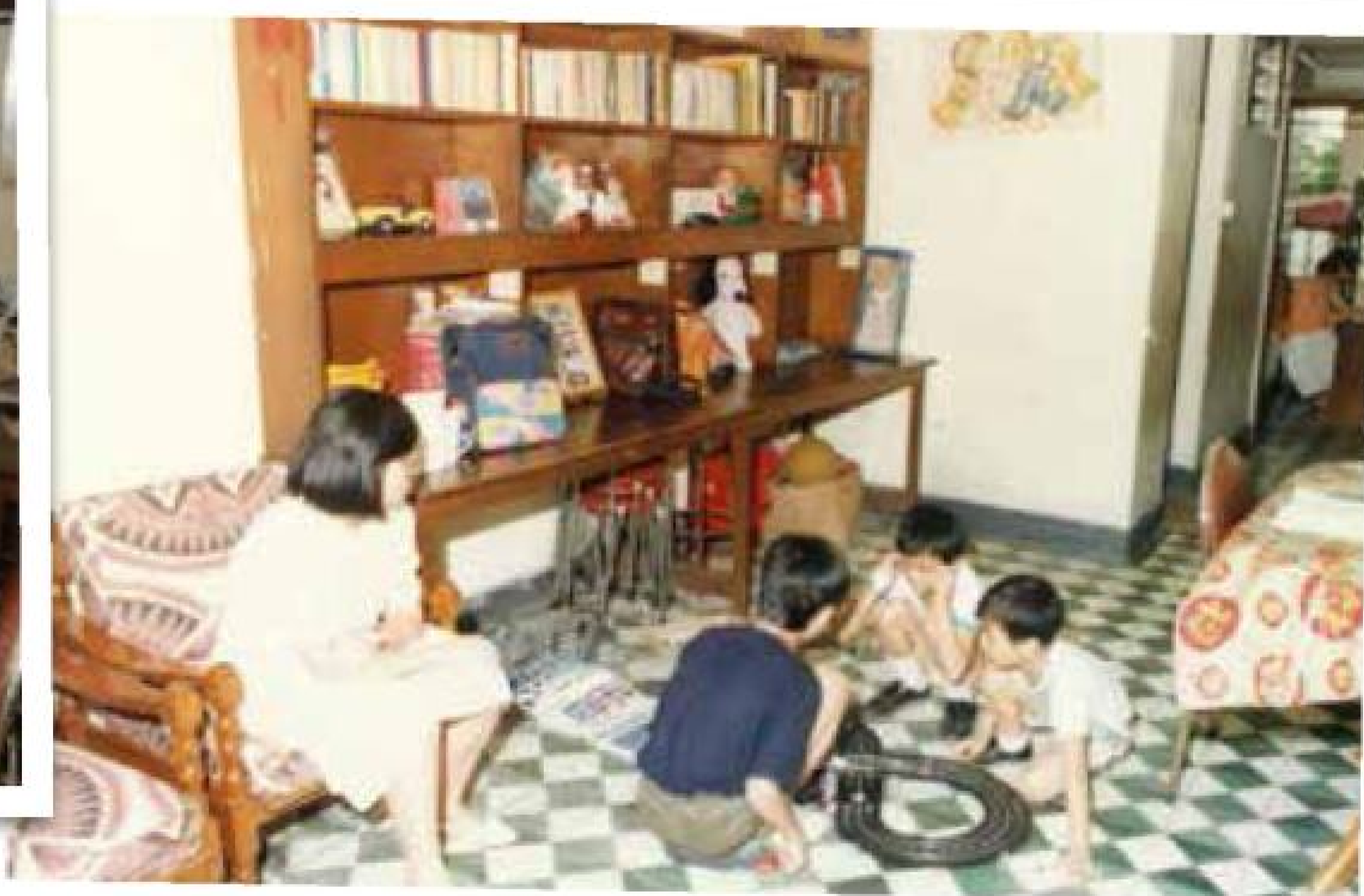
保良局在1975年開辦首間兒童之家，照顧有需要的小朋友。