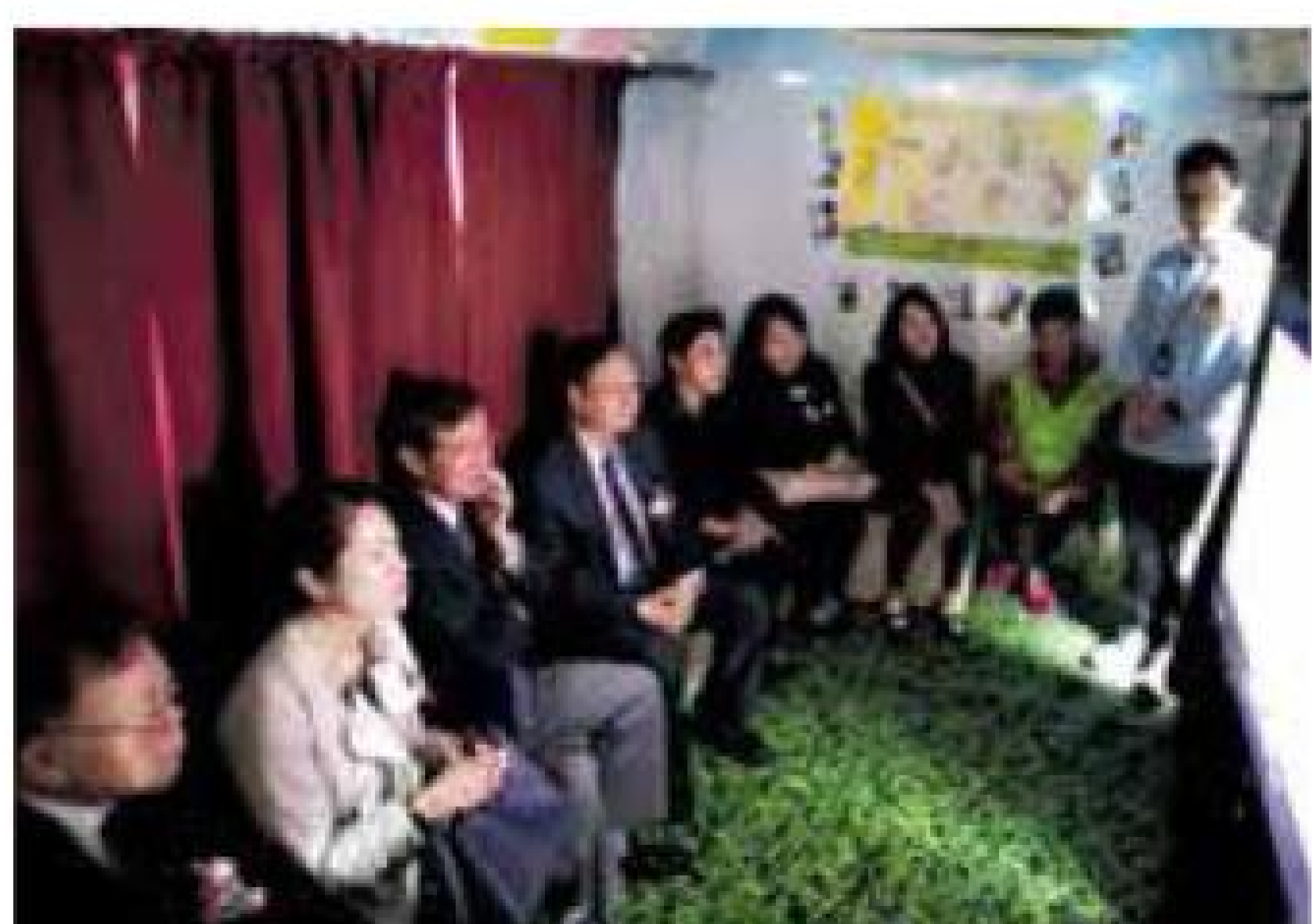
一眾嘉賓觀看「生命號」體驗館短片。

保良局安老服務早前舉行「生命號」與你同行生命路計劃回顧，以及「表達愛·愛表達」Hashtag比賽頒獎禮，向公眾宣傳生死教育宣揚，灌輸「生命無價·活在當下」的訊息。