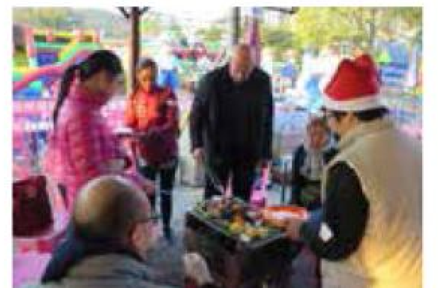
Rabobank “Yummy Xmas” BBQ 受惠單位：天朗膳糧坊