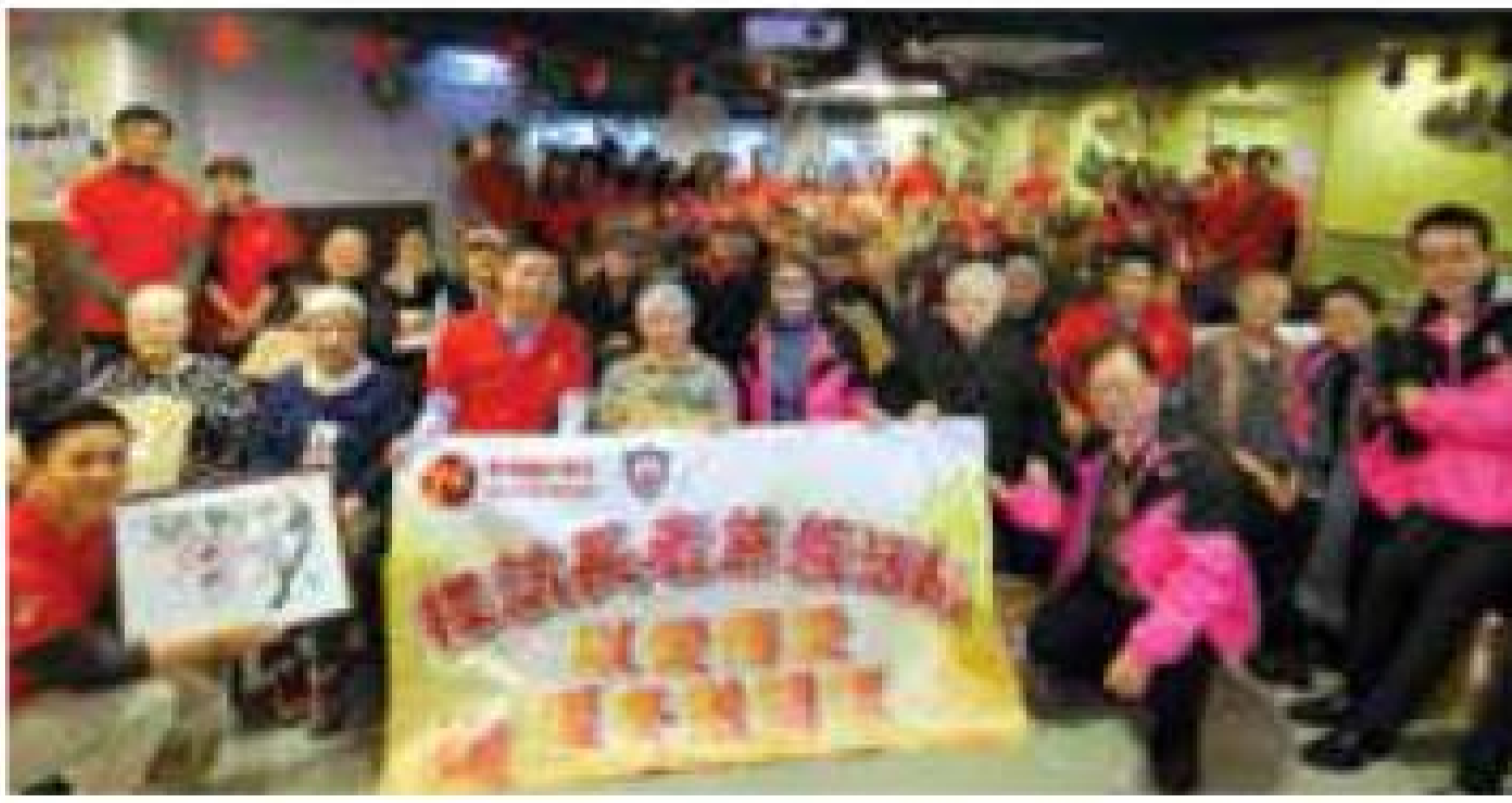
香港國際投資集團有限公司 冬至探訪 受惠單位：灣仔護老院暨長者日間護理中心