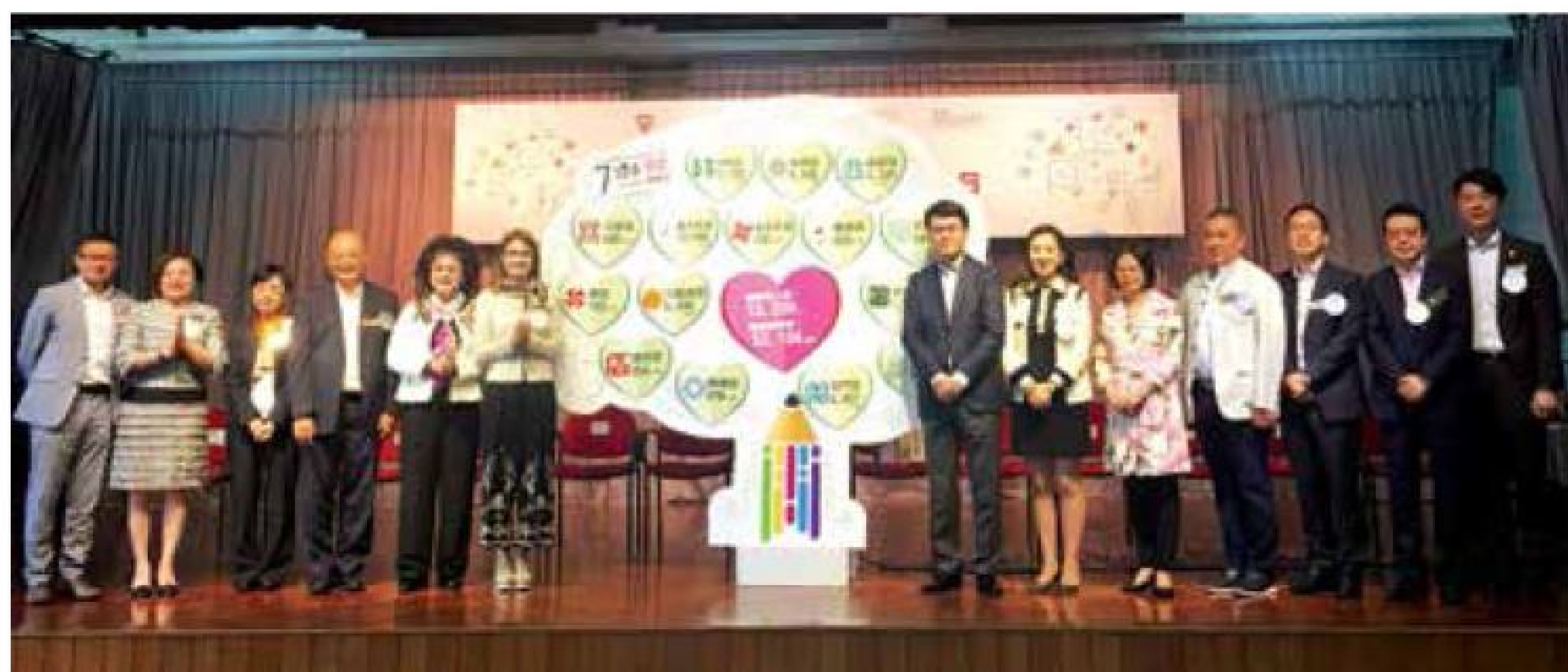
保良局舉行「香港7,305日一回歸20載保良精神日」頒獎禮，並邀得邱騰華局長 GBS, JP (右七) 出席主禮。