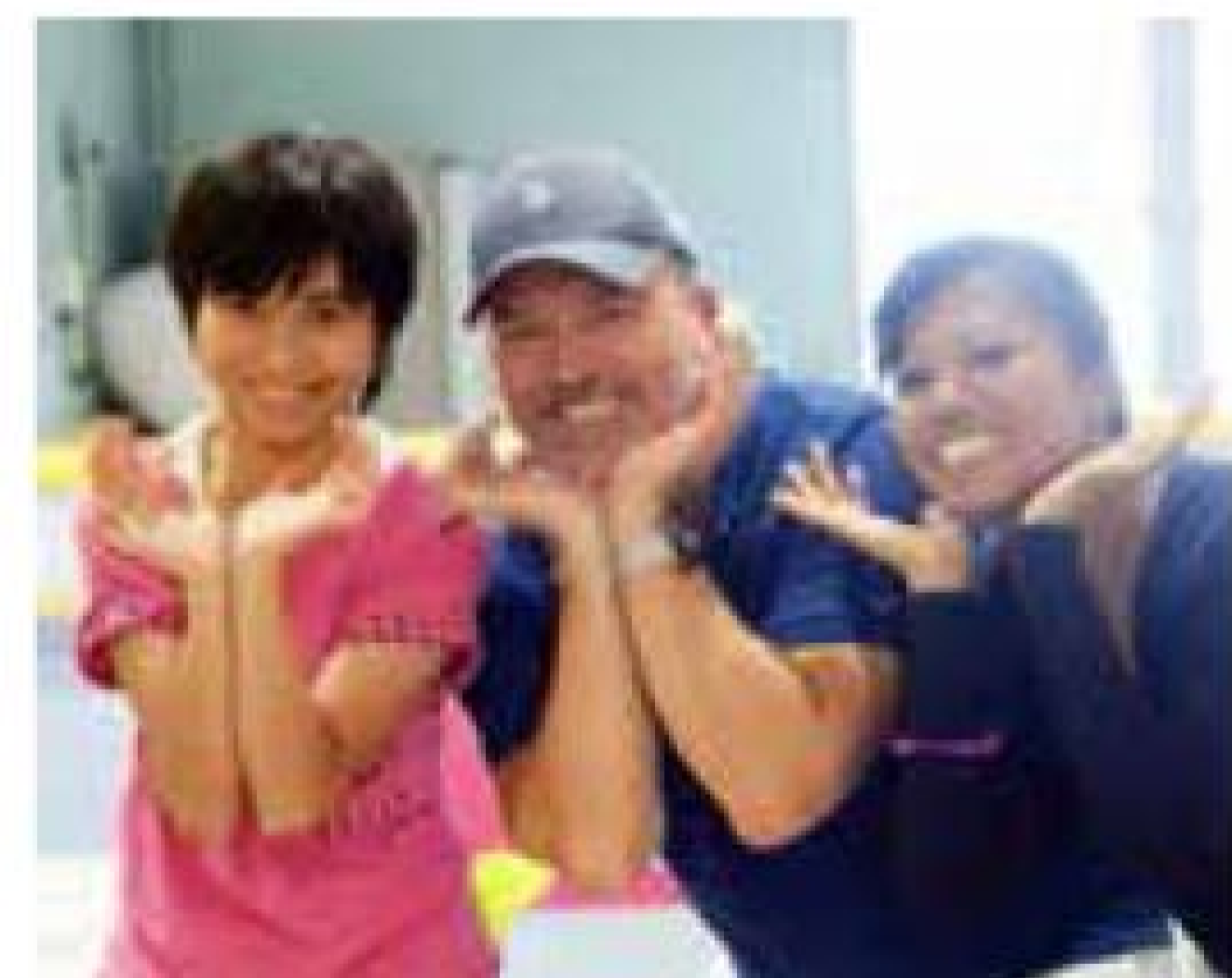
Societe Generale 變幻萬花筒