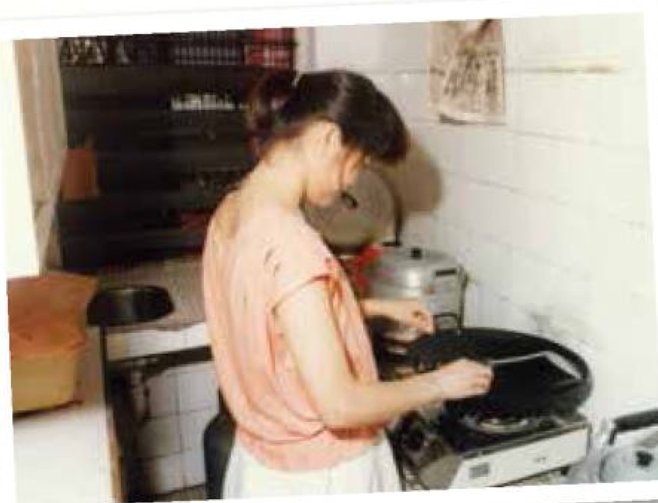
「家長」會為小朋友準備日常膳食。