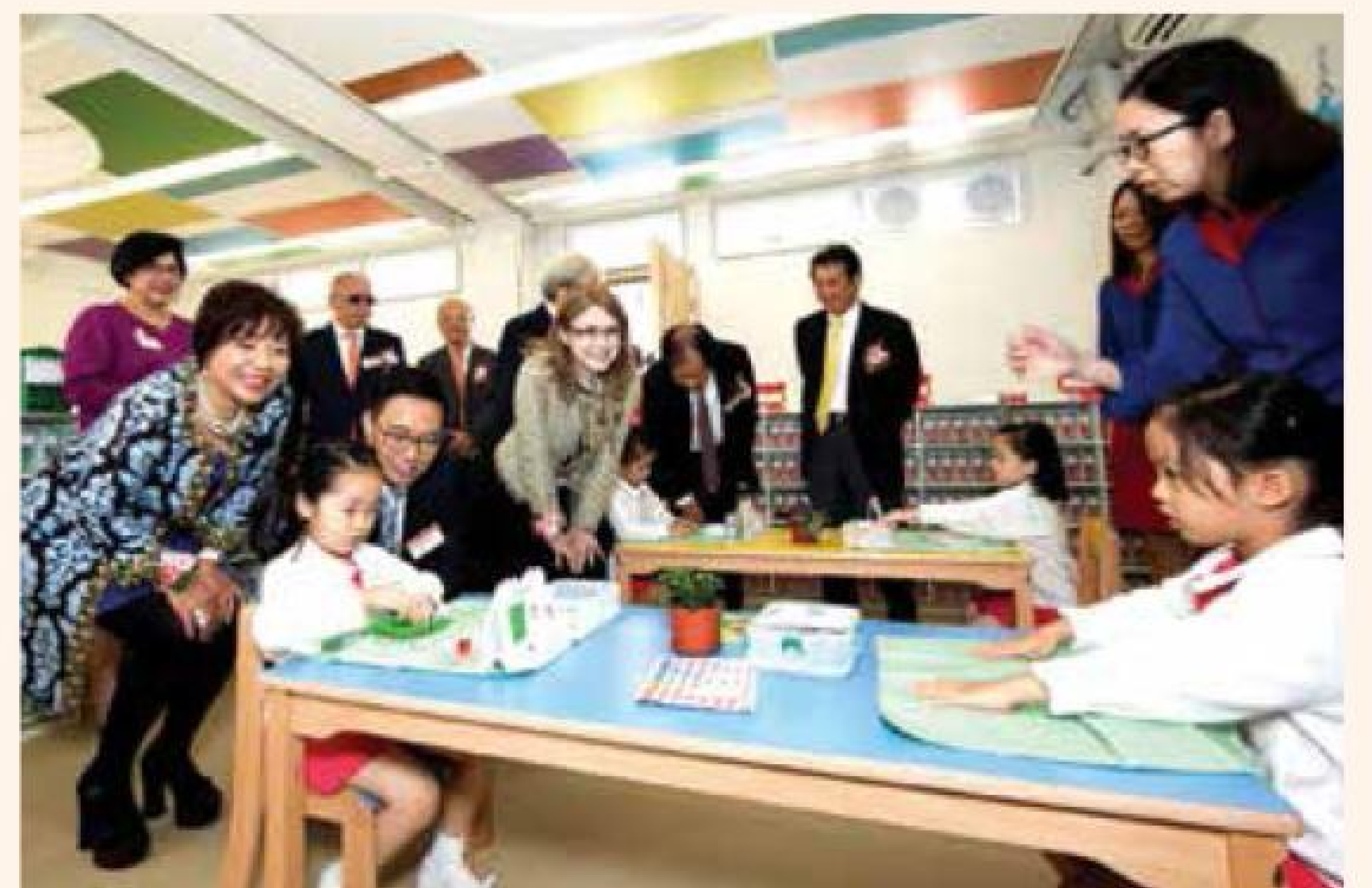
楊潤雄局長,JP(前左3)參觀校園設施，了解學生平日課堂學習情況。

目前學生人數250人，其中180人就讀全日班 地址：觀塘利安道1號順安商場2號舖 電話：2386 6983 網址： https://goo.gl/WzjfmU