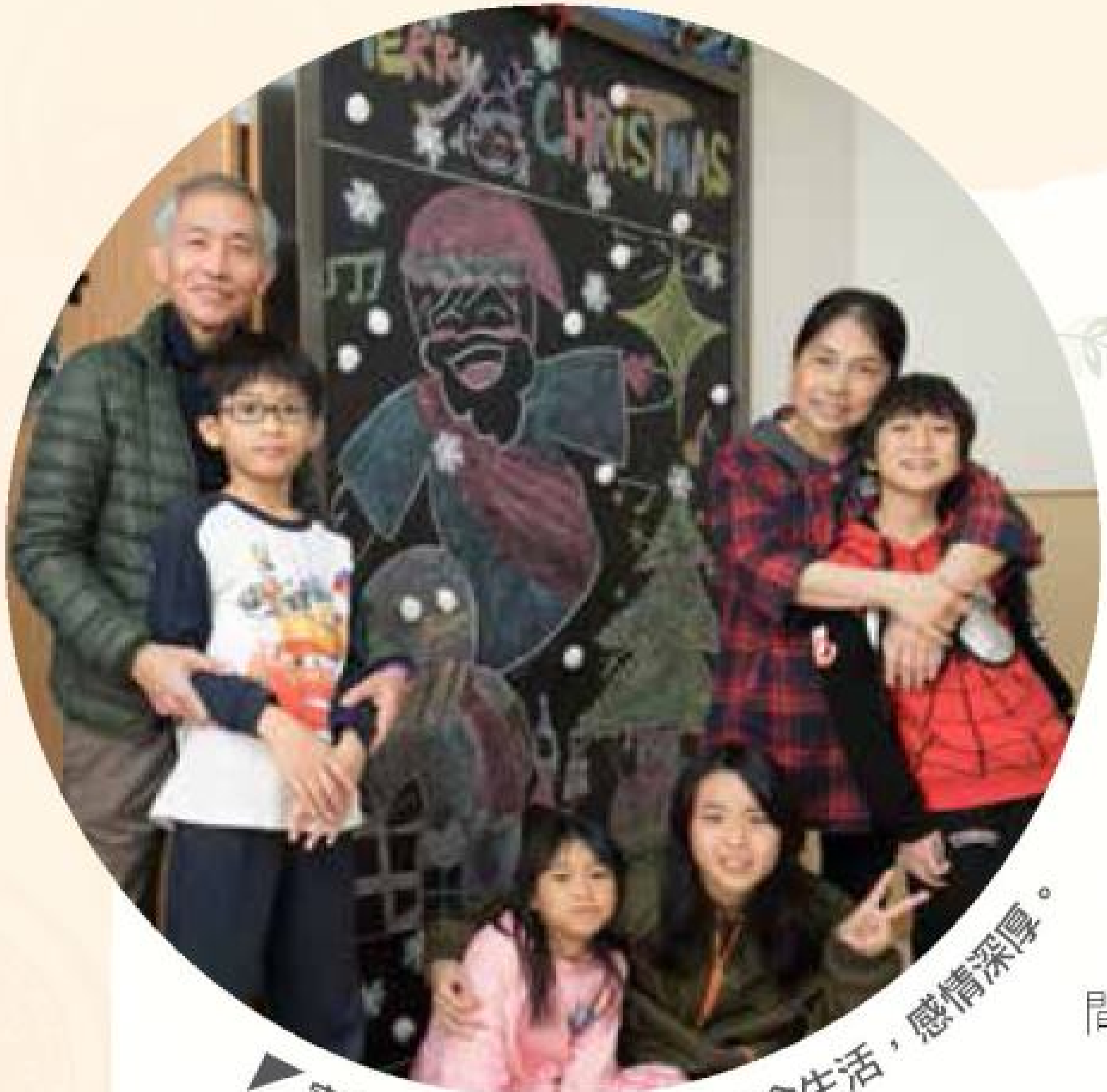
家長與小朋友們一起在家舍生活，感情深厚。