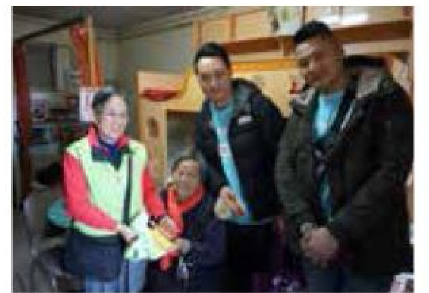
大金冷氣(香港)有限公司 探訪獨居長者 受惠單位：劉陳小寶耆暉中心