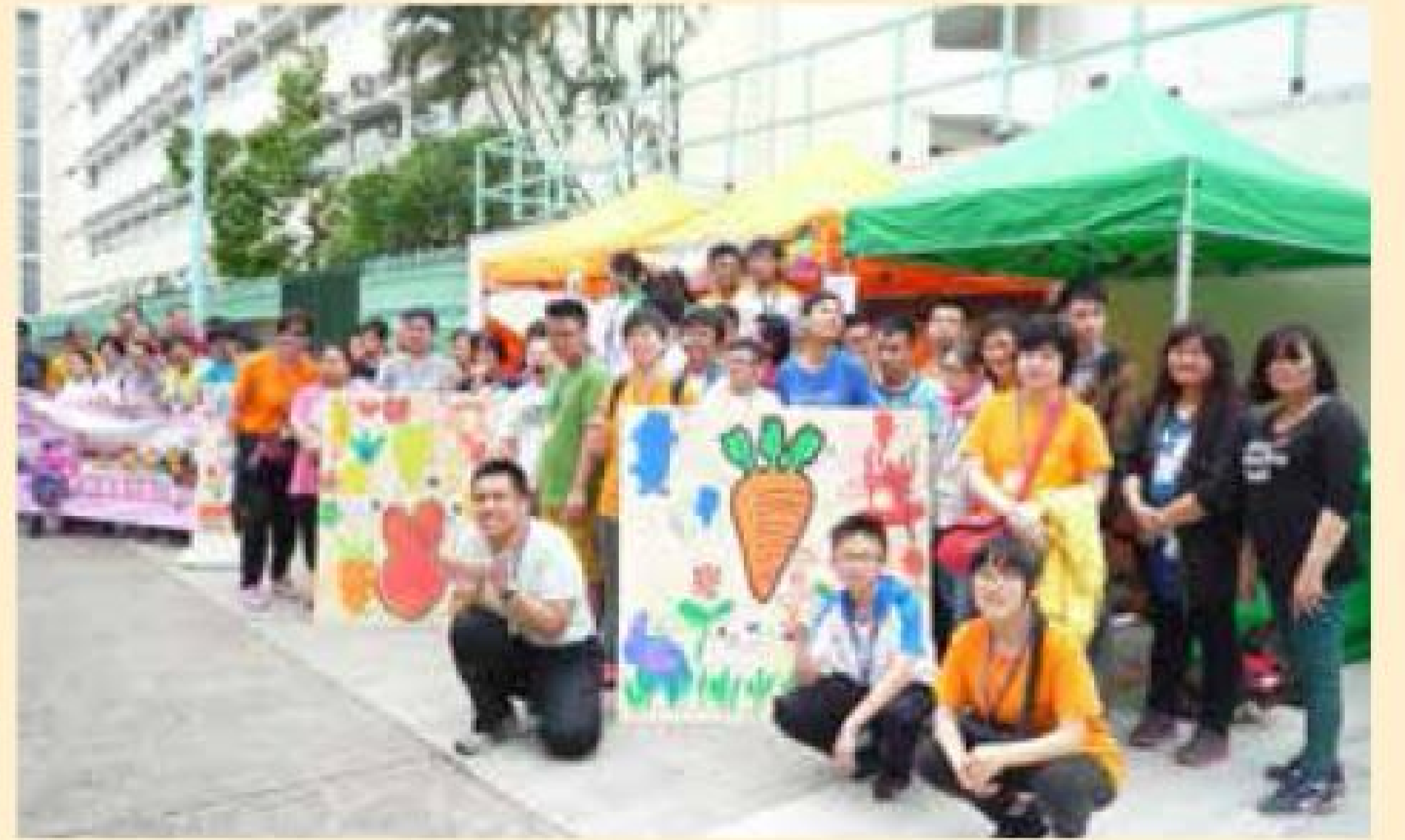
▲「友福同聚」在社區舉行不同活動，推廣傷健共融。

2017年為「國際復康日」25周年，保良局在元朗區推行的「友福同聚」社區傳統技藝共融計劃及綠色關愛計劃，獲得「十八區傑出共融社區推廣計劃」的銅獎。