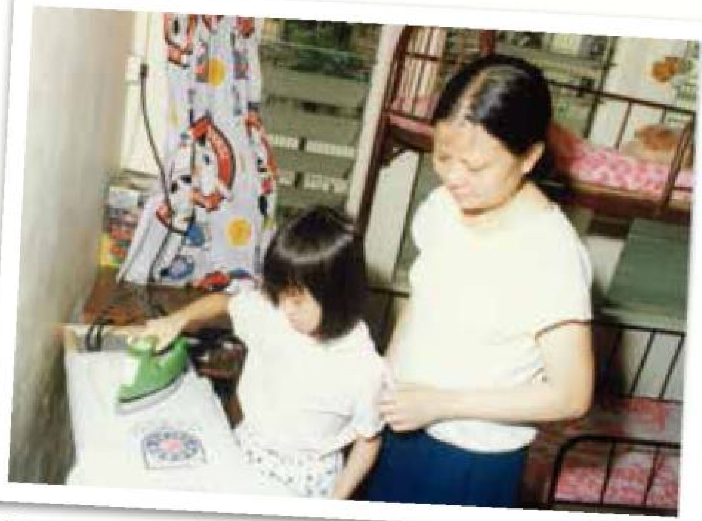
家長會教導小朋友日常自理，如收拾床鋪、熨校服等。