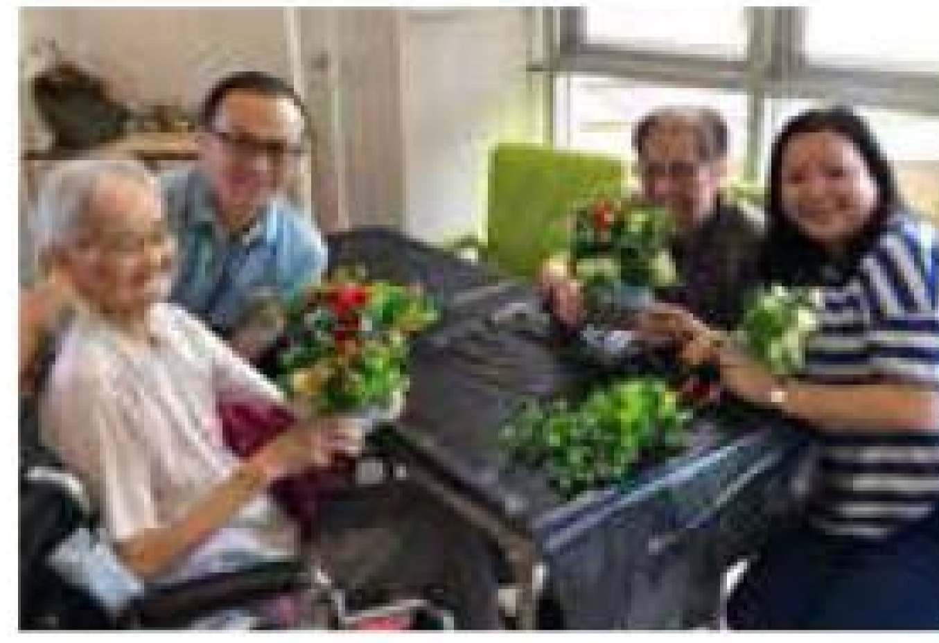
威富(亞洲區)有限公司 綠化天台 受惠單位：黃竹坑護理安老中心