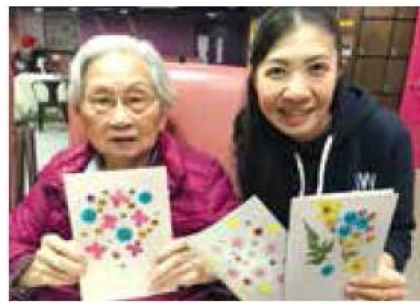
黃波記有限公司 長者日心意卡製作 受惠單位：灣仔護老院暨長者日間護理中心