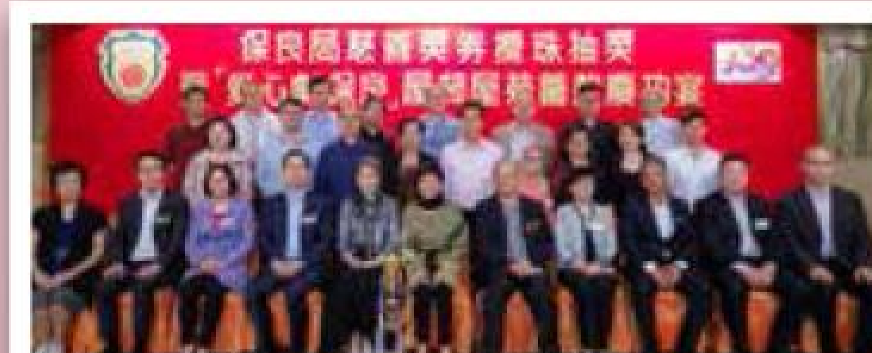
屋苑及團體組季軍 香港群心曲藝苑