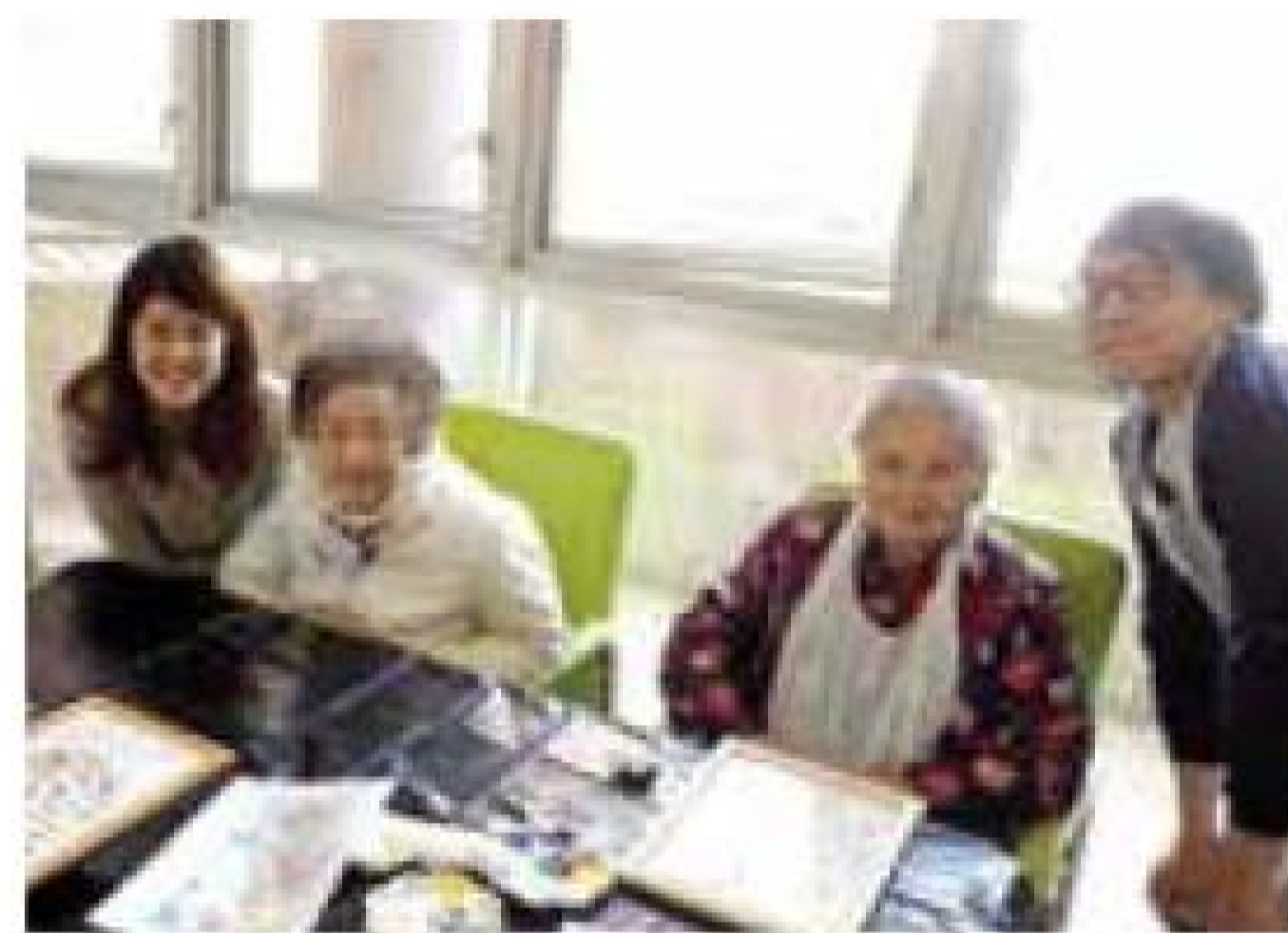
新興集團 綠化天台 受惠單位：黃竹坑護理安老中心