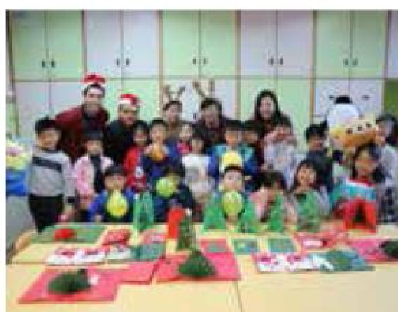
百事公司 聖誕節慶祝活動