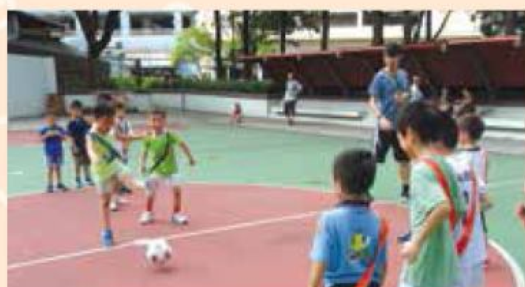
「足球小小將計劃」將大肌肉訓練融入足球運動，SEN兒童在玩樂中提升能力。