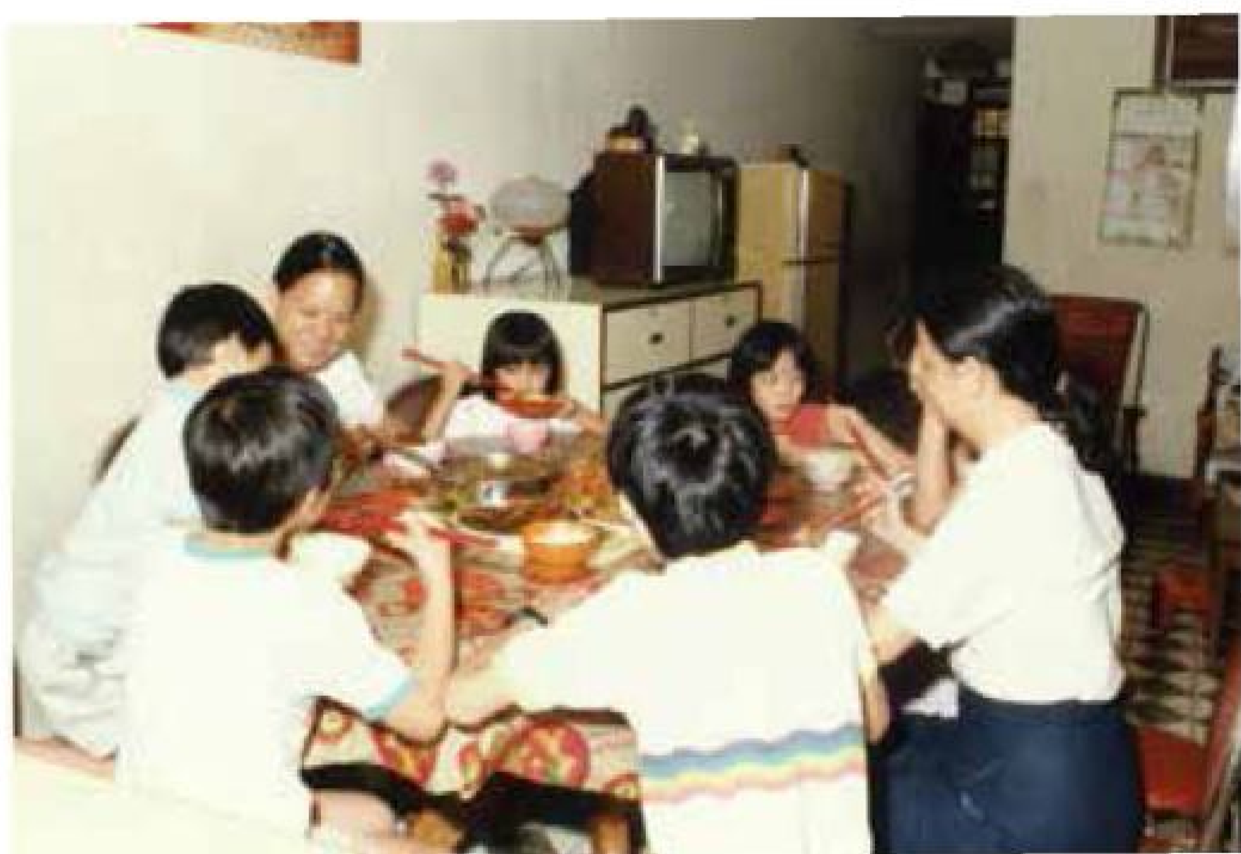
兒童之家由一對夫婦擔任「家長」照顧小朋友，讓他們感受家庭生活的溫暖。

每間兒童之家收容8名兒童，年齡介乎4至18歲。兒童屬過渡性質居住，計劃期望兒童能回歸其原生家庭，與家人團聚。兒童之家內除了有「家長」負責照顧兒童日常基本生活所需，本局亦安排專業人員為兒童提供康樂活動，及安排參加興趣班和補習課程，致力培育兒童成材。