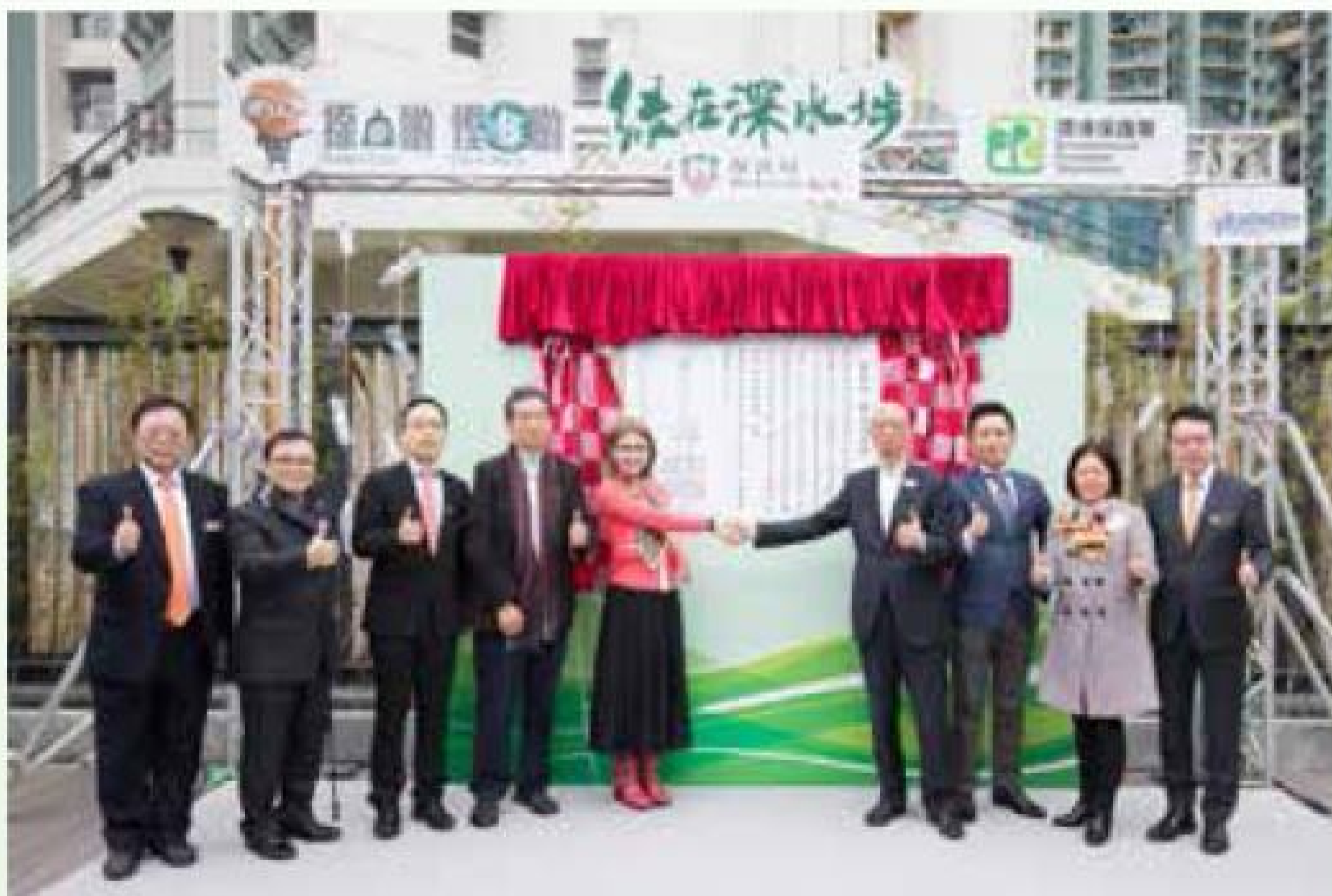
主禮團嘉賓為「綠在深水埗」主持揭牌儀式。