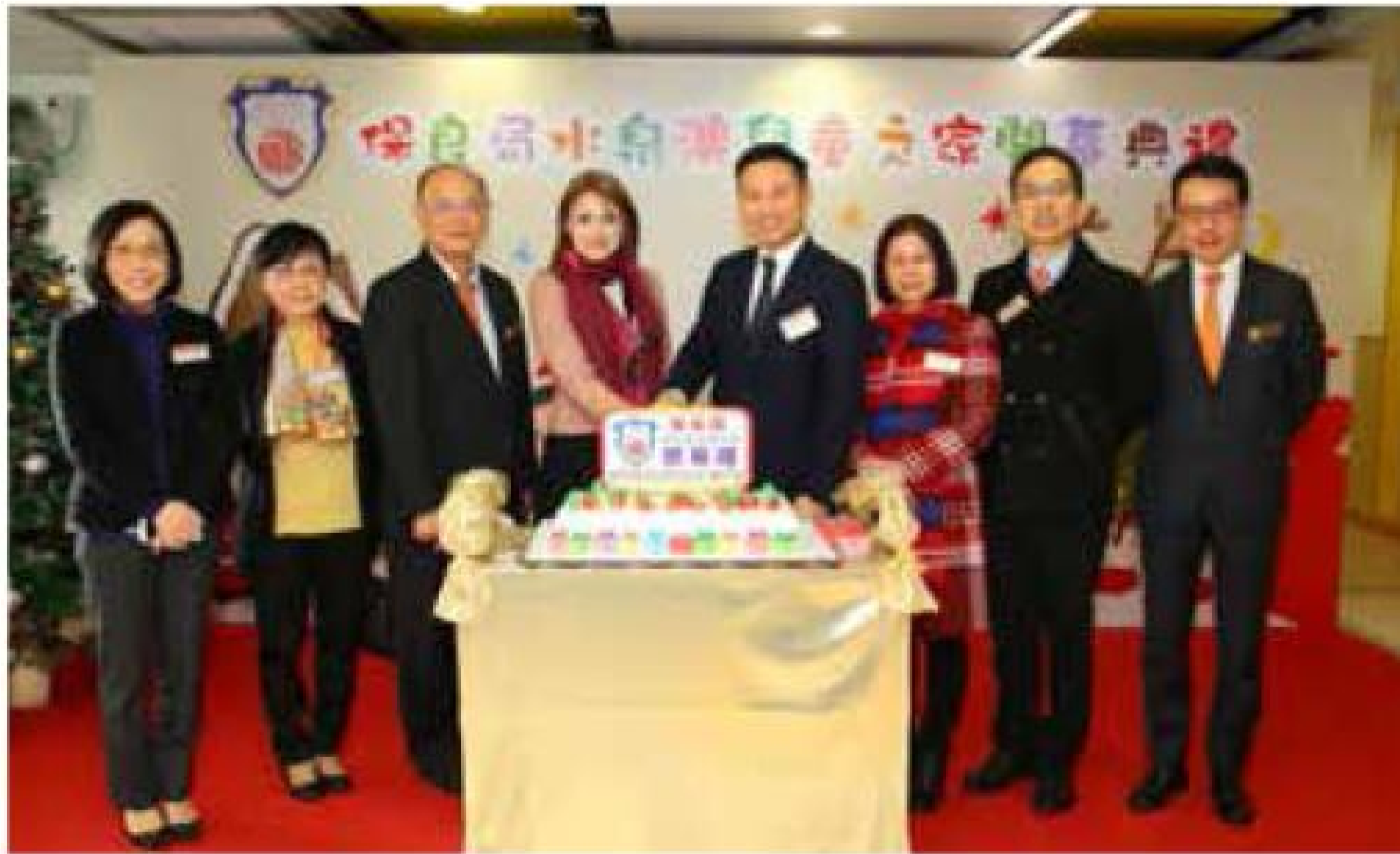
水泉澳兒童之家早前正式開幕，主禮人勞工及福利局副局長徐英偉,JP(右四)聯同一眾主禮嘉賓到家舍切蛋糕 House Warming。

家舍按小朋友成長需要，定期舉行益智的興趣班，例如非洲鼓、舞獅等，讓他們在溫暖的大家庭內接觸不同新事物，並發揮才華。