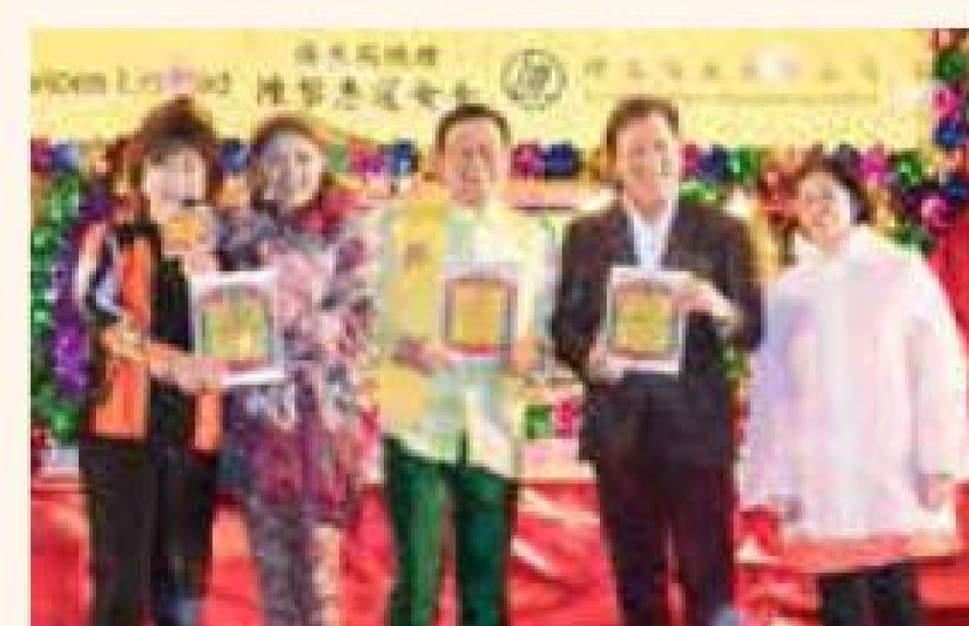
演藝嘉賓們毋懼風雨,演出專業