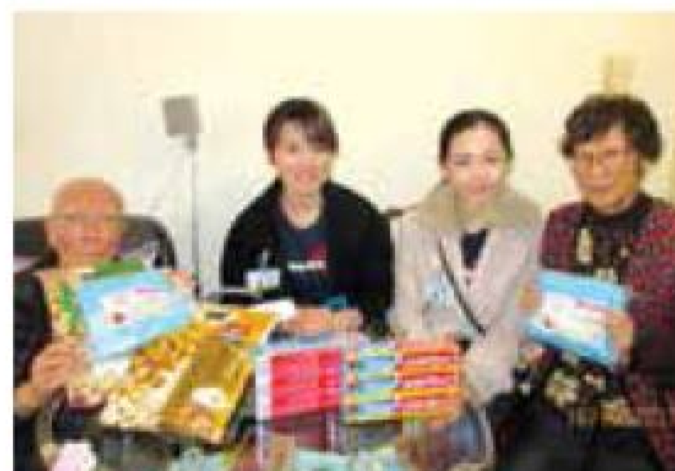
萬興行 探訪獨居長者 受惠單位：莊啟程耆暉中心