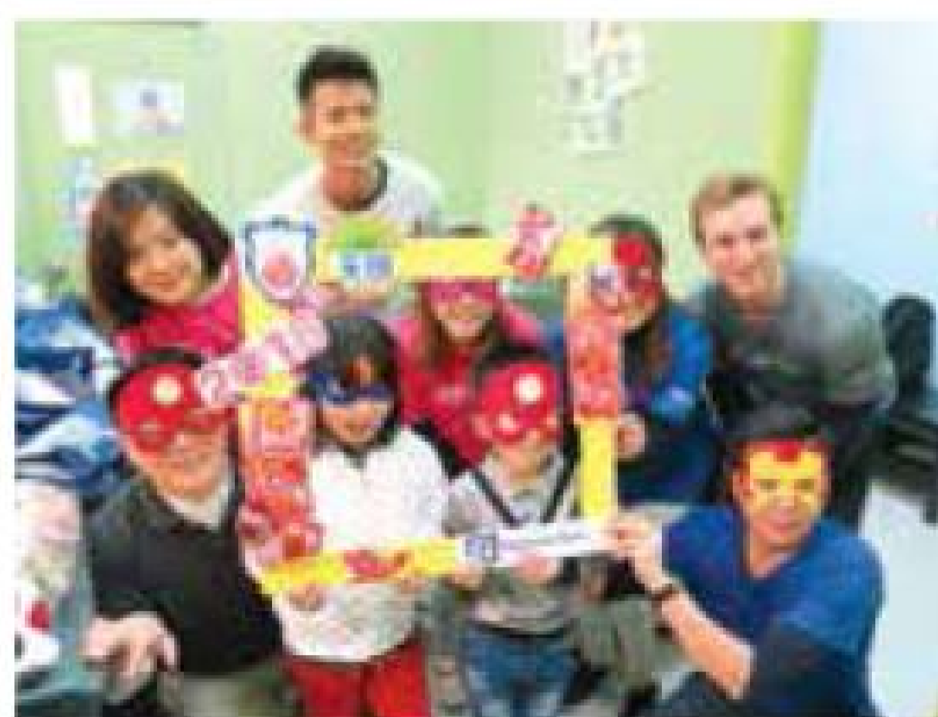
Deutsche Bank 聖誕探訪