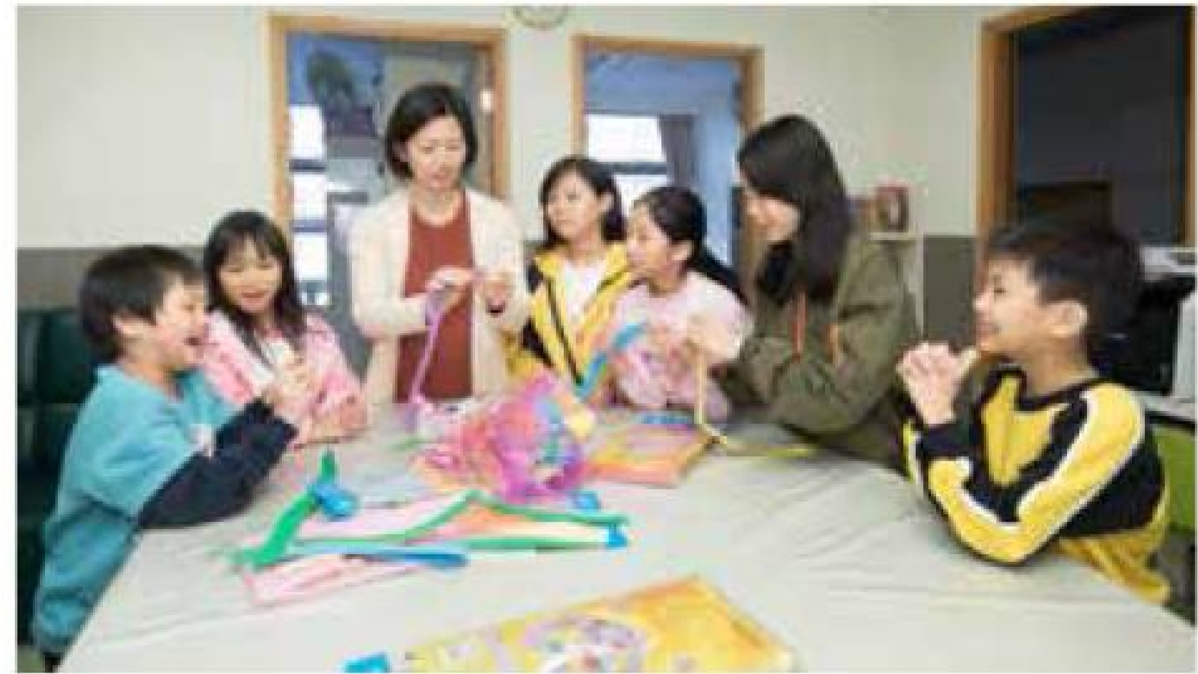
水泉澳4間兒童之家位處同一樓層，小朋友們可一起學習及玩遊戲。