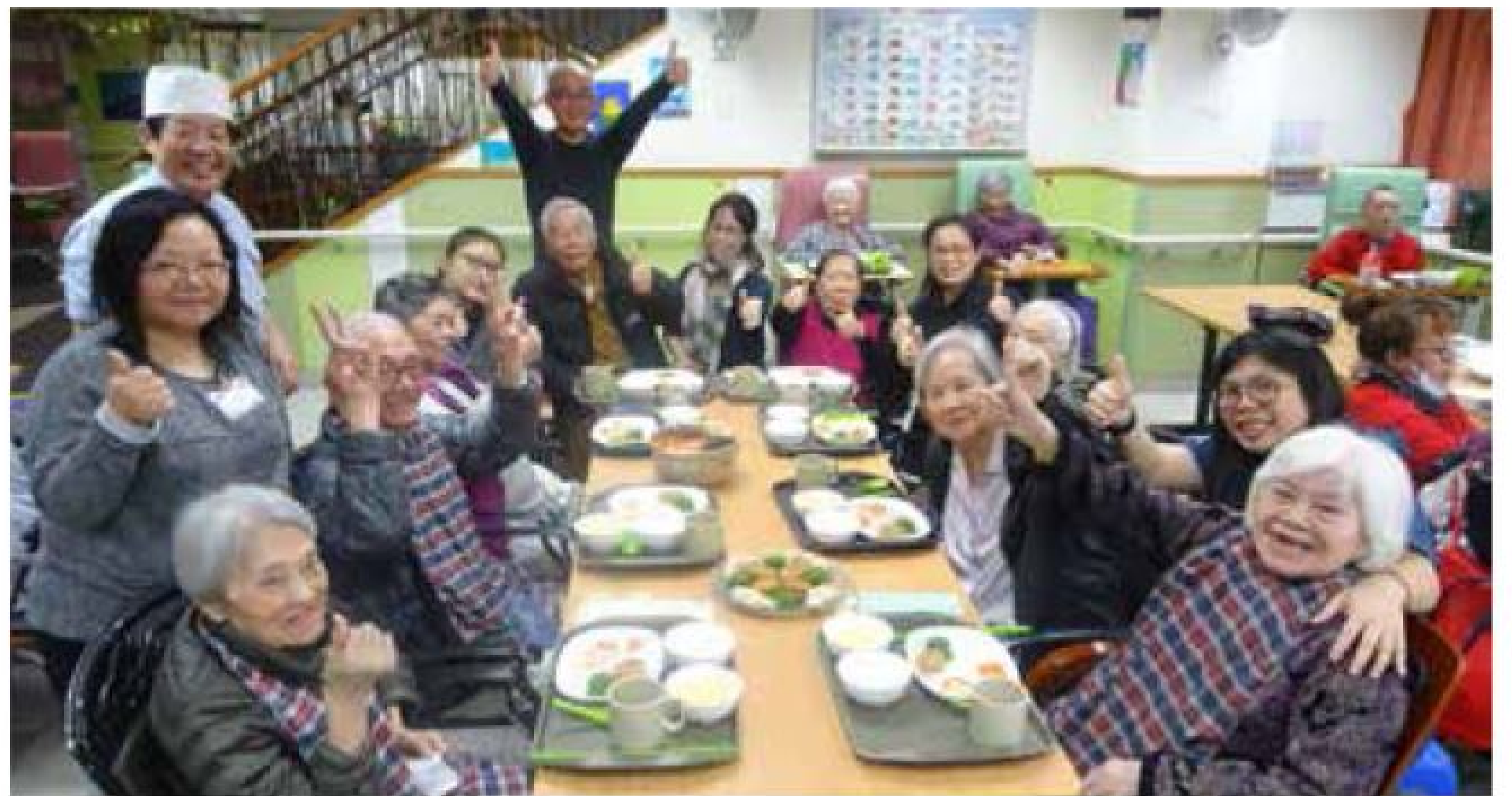
體弱長者也能進食色香味俱全的冬至飯，笑得十分開懷。