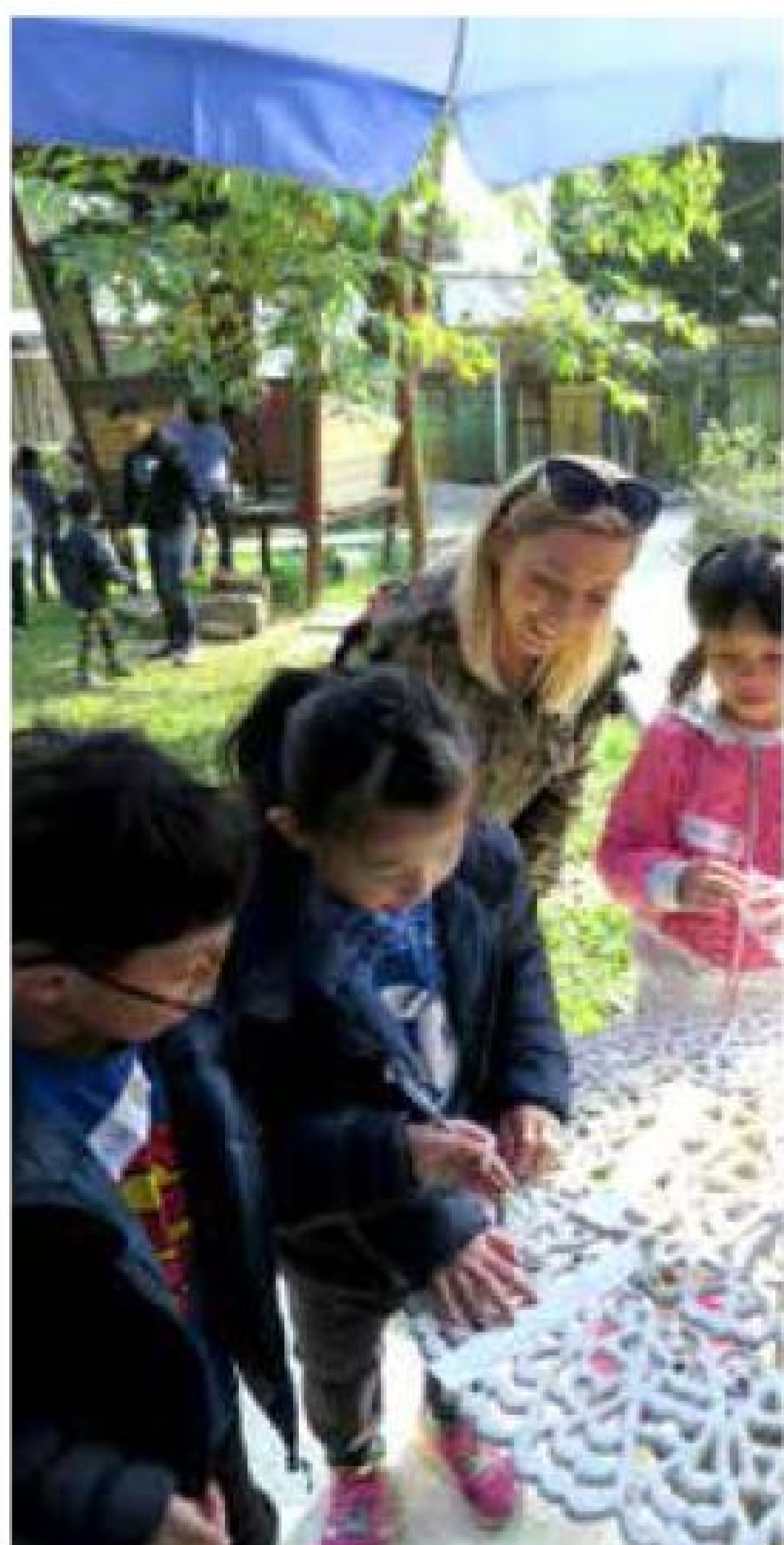
InfoPro Digital 樹屋田莊開心玩