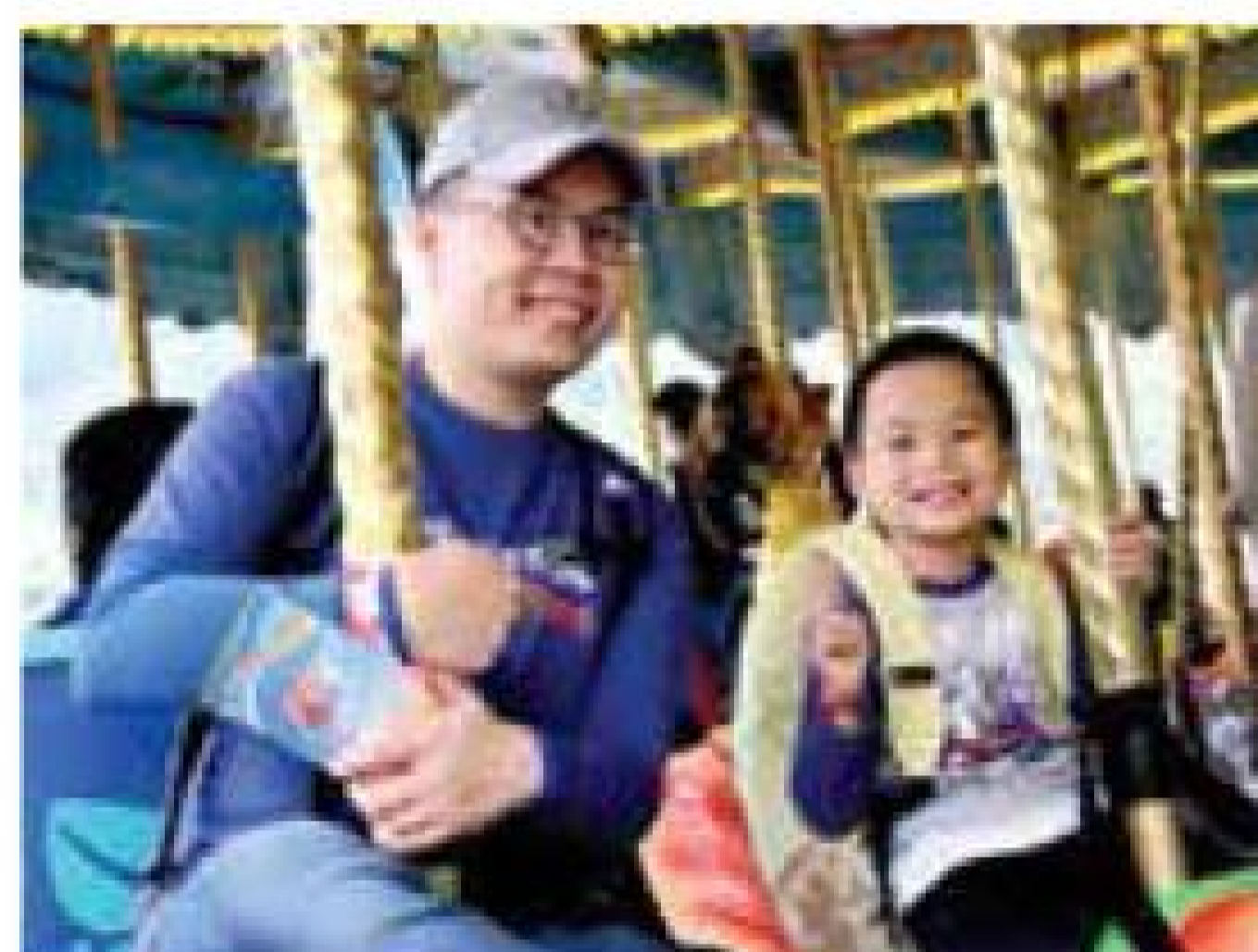
Morgan Stanley 海洋公園黃昏之旅