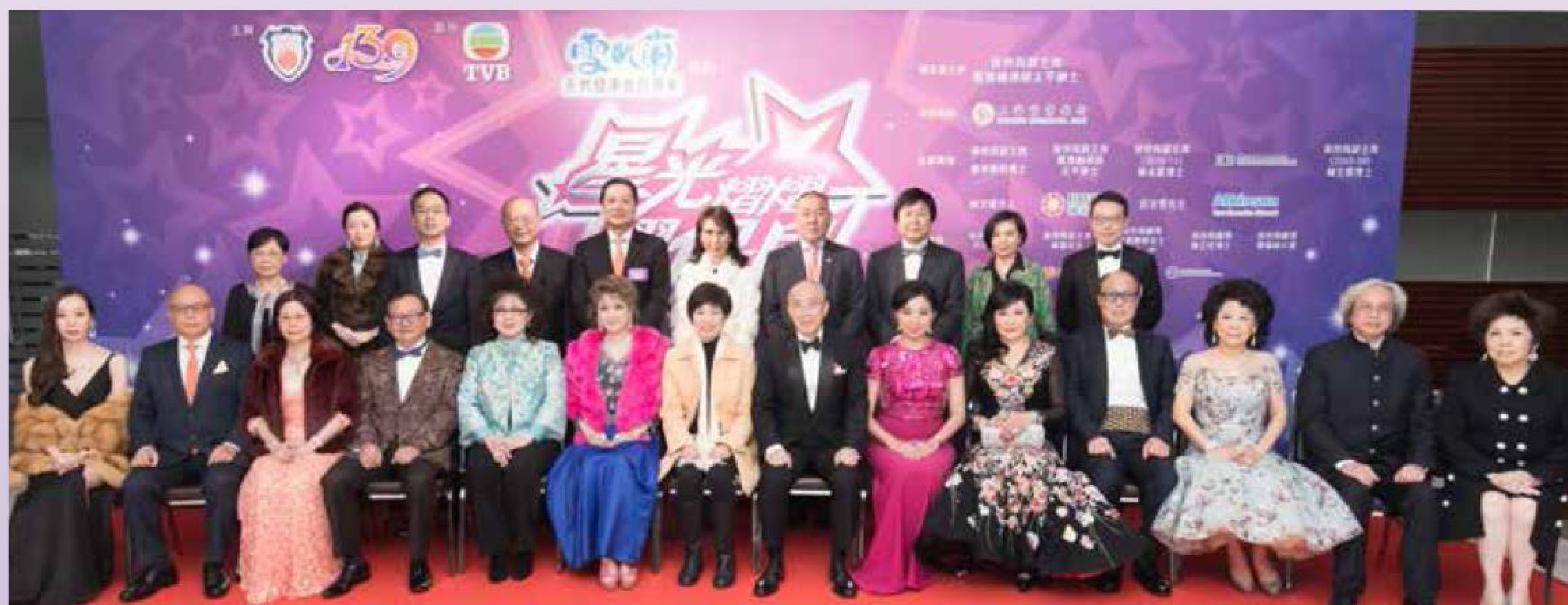
主禮嘉賓署理民政事務總署署長黃海韻女士(前排左七)與本局董事會成員伉儷、顧問、節目贊助及嘉賓合照。