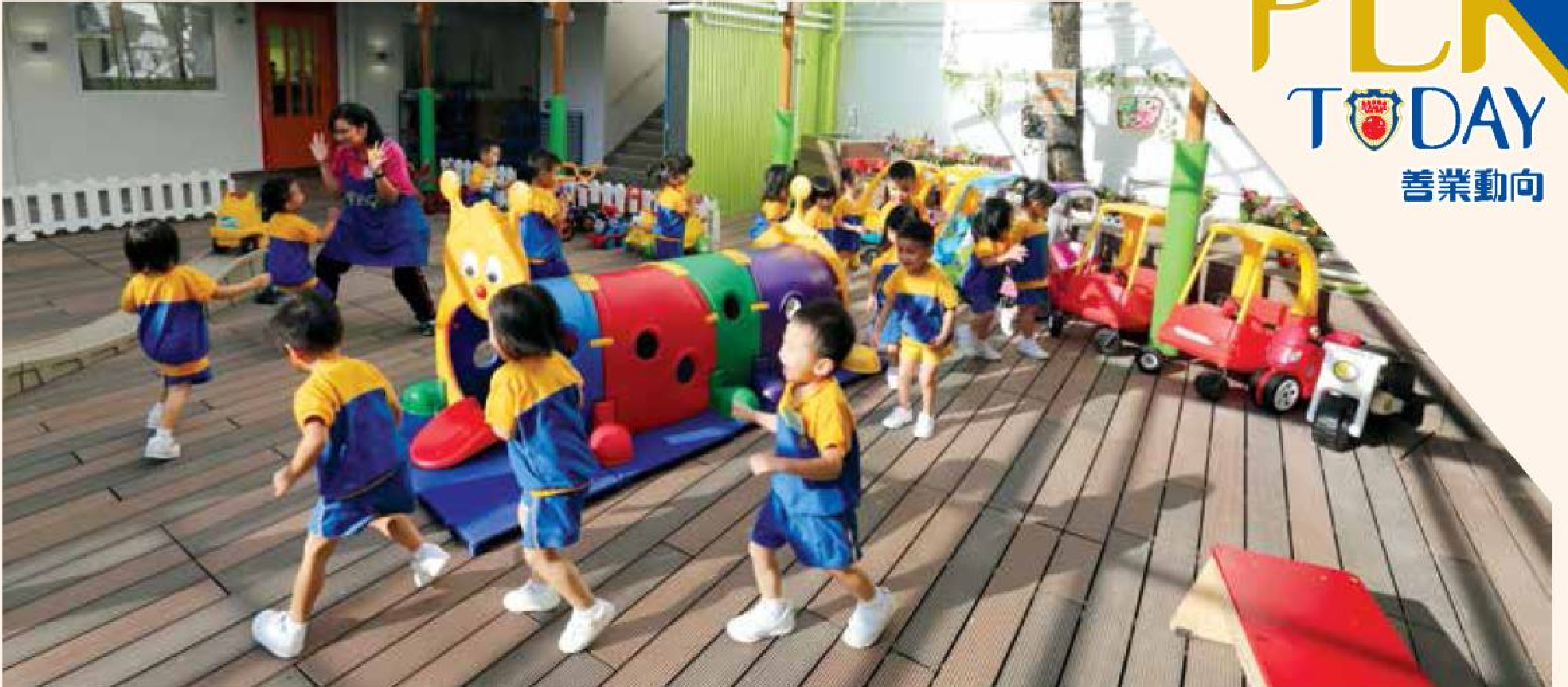
保良局李樹福幼稚園課程設計以遊戲為框架，學生可從遊戲中學習。