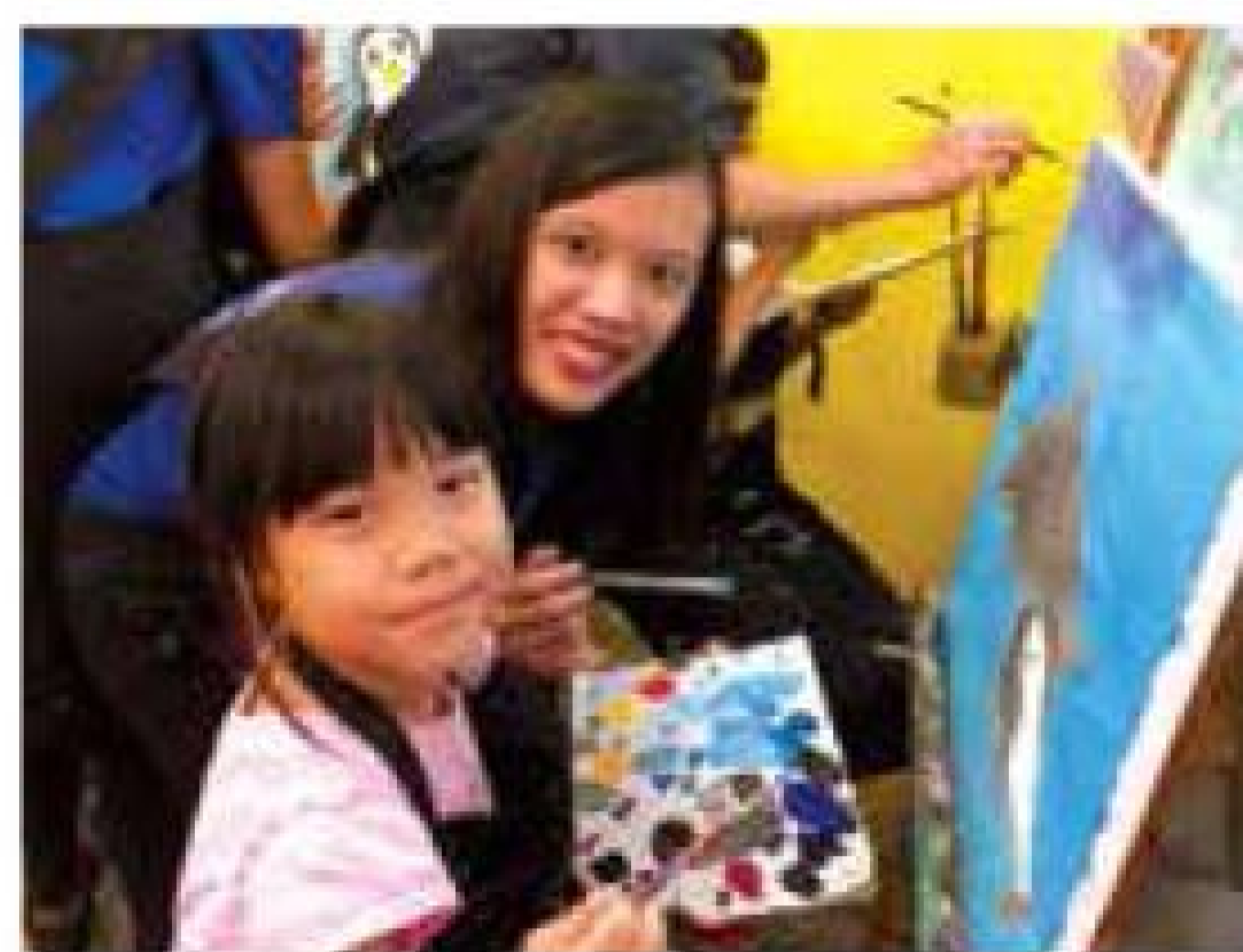
JP Morgan Art Jam