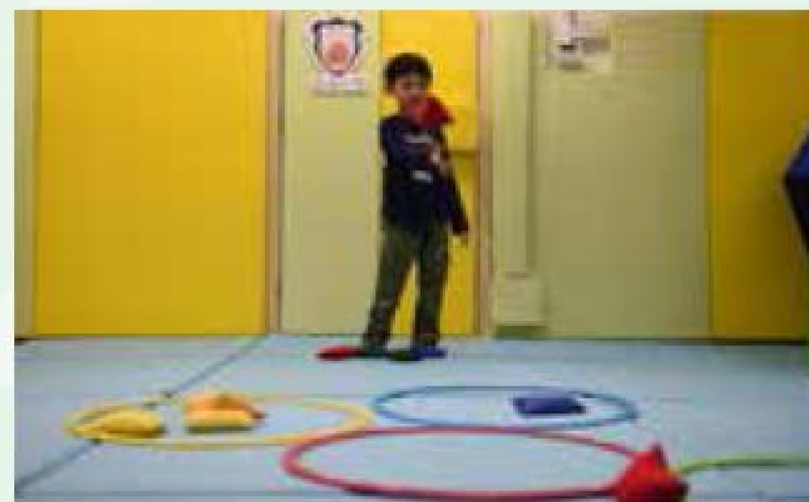
家長可在放置不同顏色的呼拉圈，教小朋友將相同顏色的物件拋到圈內。