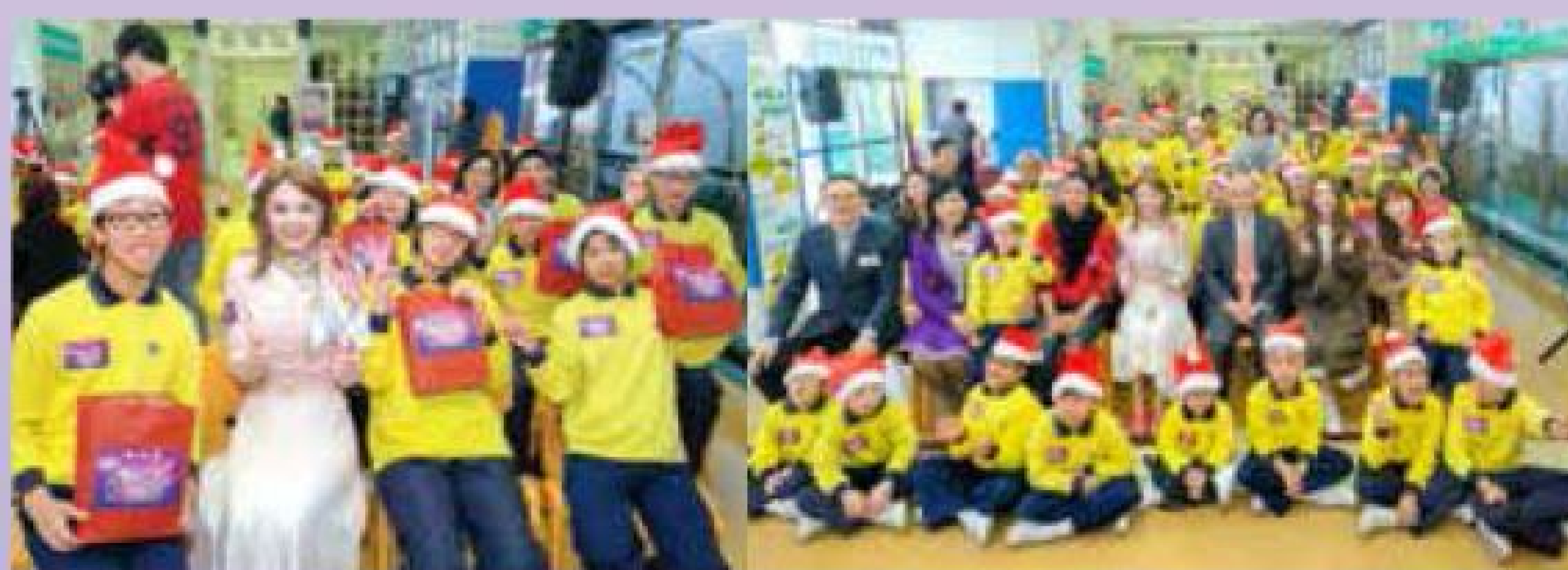
探訪保良局余李慕芬紀念學校