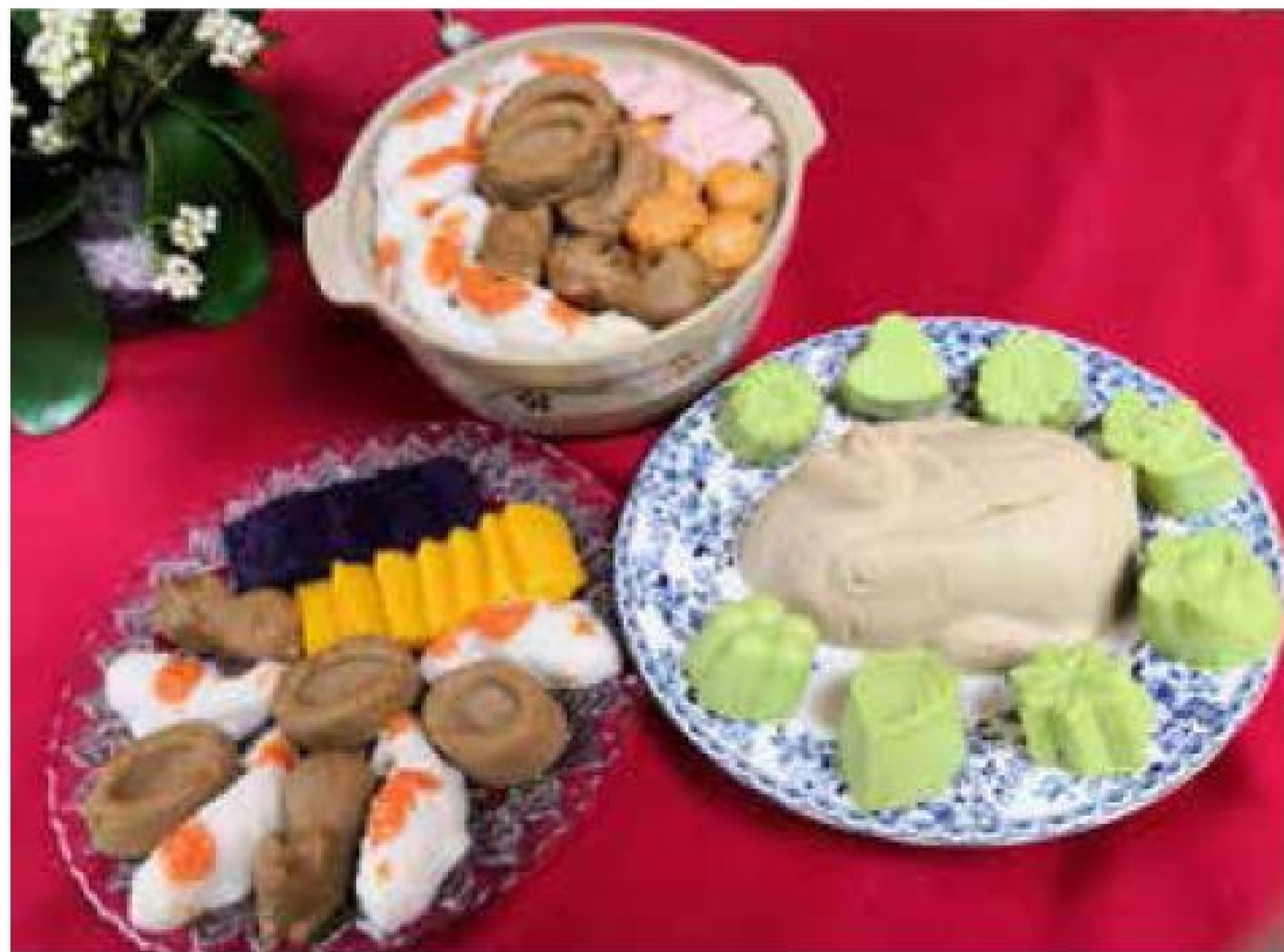
「鮑魚盆菜」、「翡翠貴妃雞」等有「型」冬至飯，令老友記食指大動。