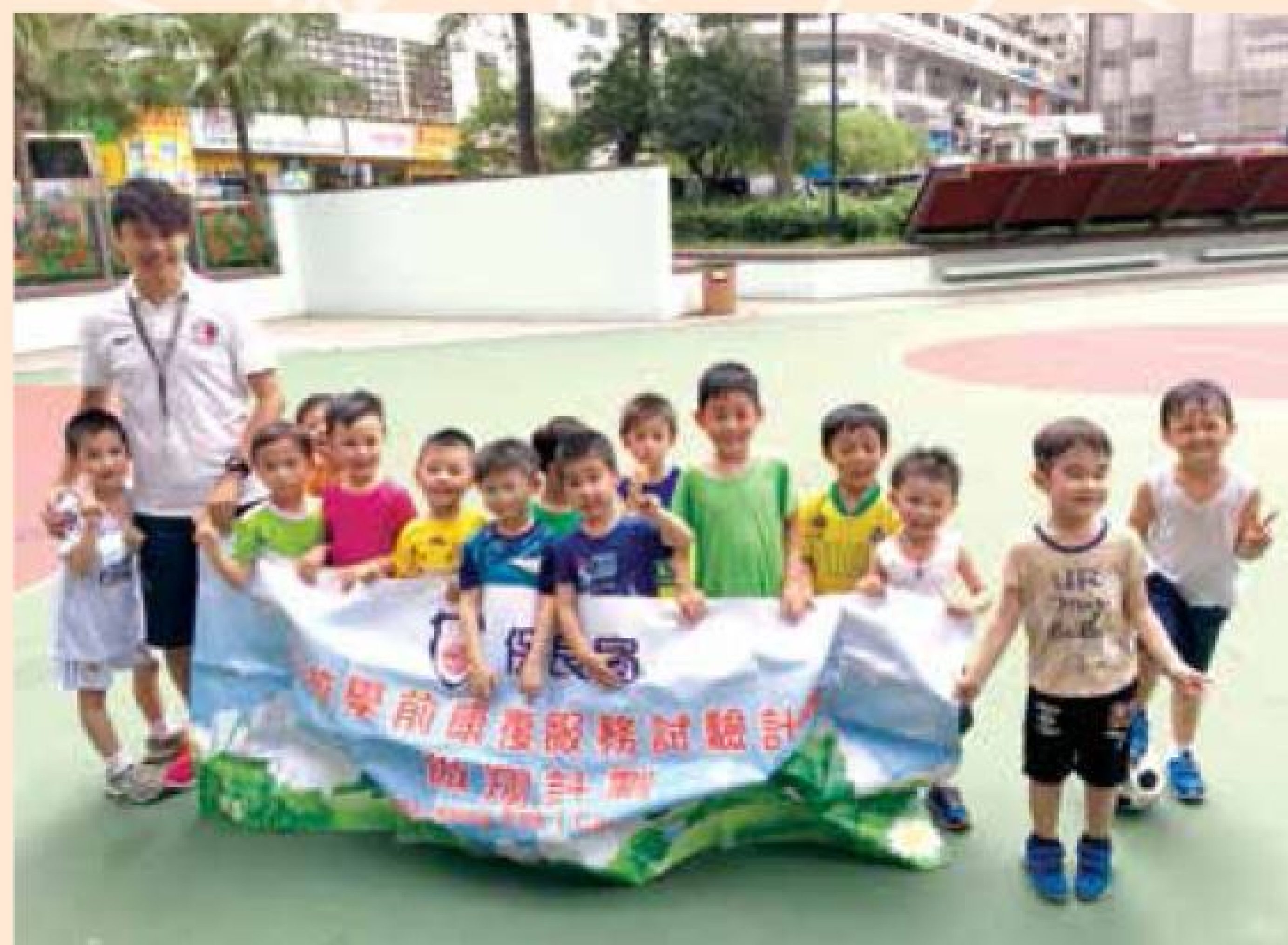
保良局傲翔計劃上年度推出「足球小小將計劃」，培養SEN兒童對運動的興趣。