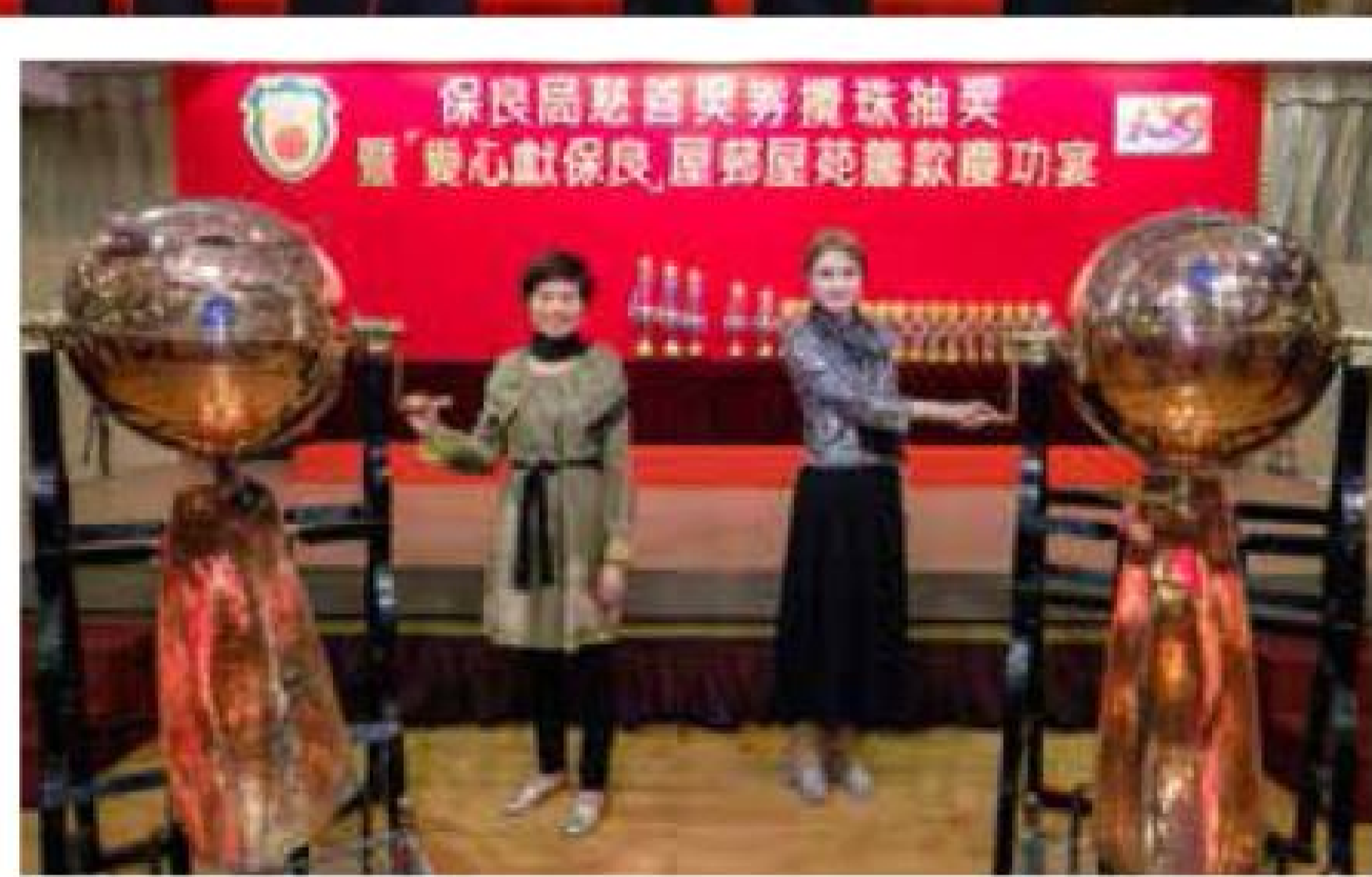
主禮民政事務總署黃海韻副署長與陳細潔主席主持攪珠抽獎儀式。

為答謝積極參與的屋邨屋苑,本局早前舉行慈善獎券攪珠抽獎暨「愛心獻保良」屋邨屋苑籌款慶功宴,並邀得民政事務總署副署長黃海韻女士,JP蒞臨主禮。是次慶功宴餐費支出全數由保良局丁酉年董事會成員贊助。