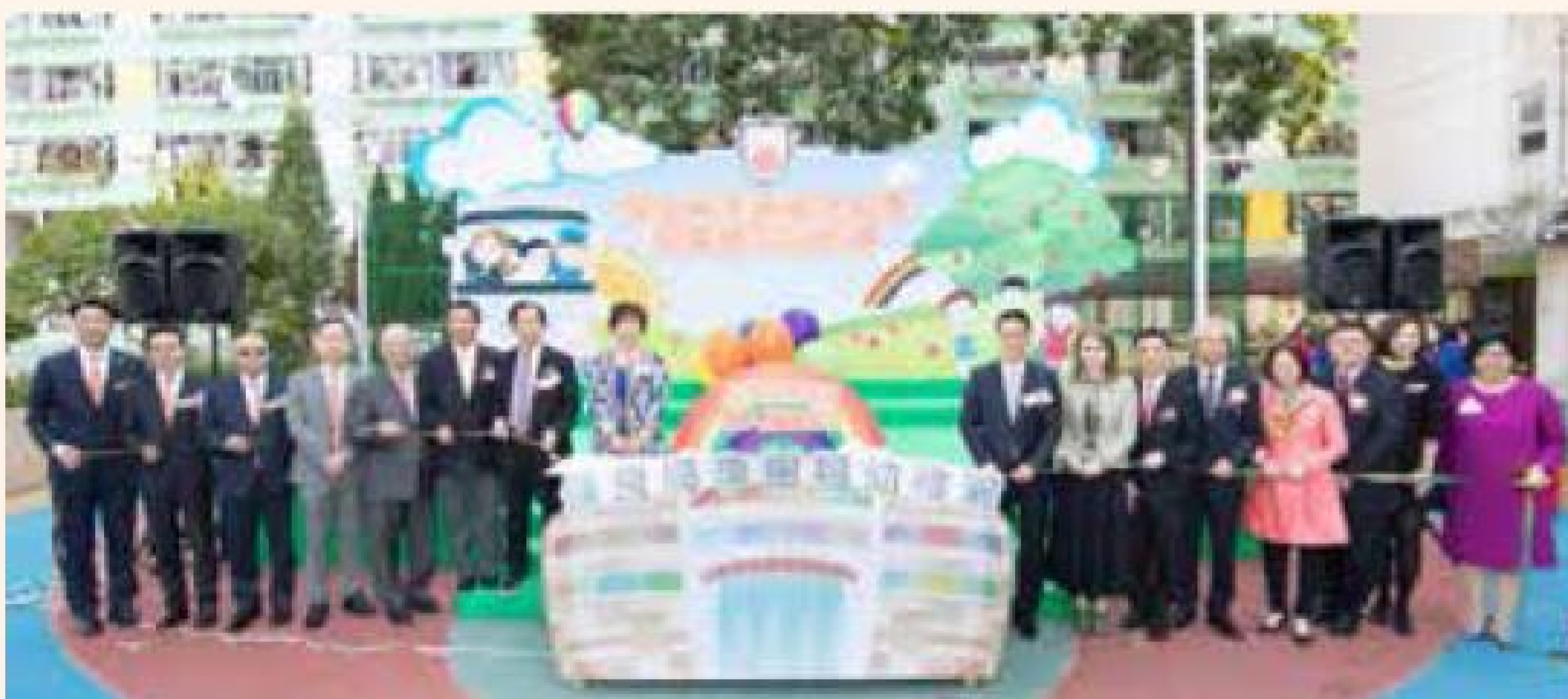
保良局李樹福幼稚園上月舉行開幕儀式。