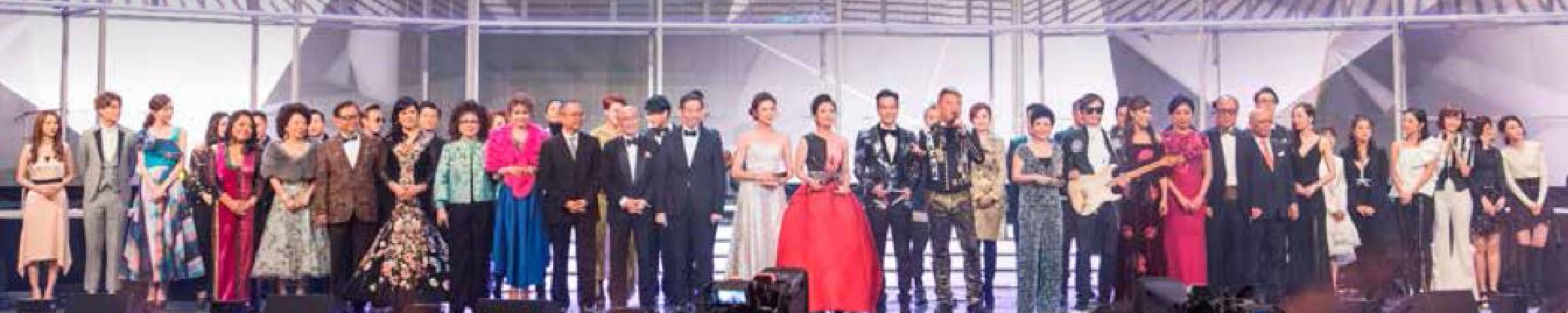
一眾主禮嘉賓團、贊助代表及表演嘉賓為晚會揭開序幕。

一年一度大型籌款晚會星光熠熠耀保良獲雪肌蘭天然健康食品專家冠名贊助，於早前隆重舉行。活動邀得民政事務局局長劉江華先生、JP 親臨主禮，多位著名歌手傾力演出，獻唱不同類型經典金曲，呼籲各界善長支持，為保良局轄下逾 300 個服務單位籌募拓展及營運經費。