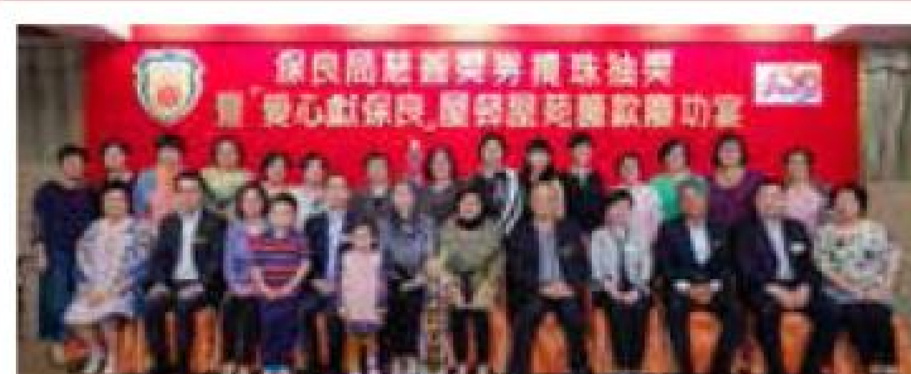
屋苑及團體組亞軍 香港力羣協會