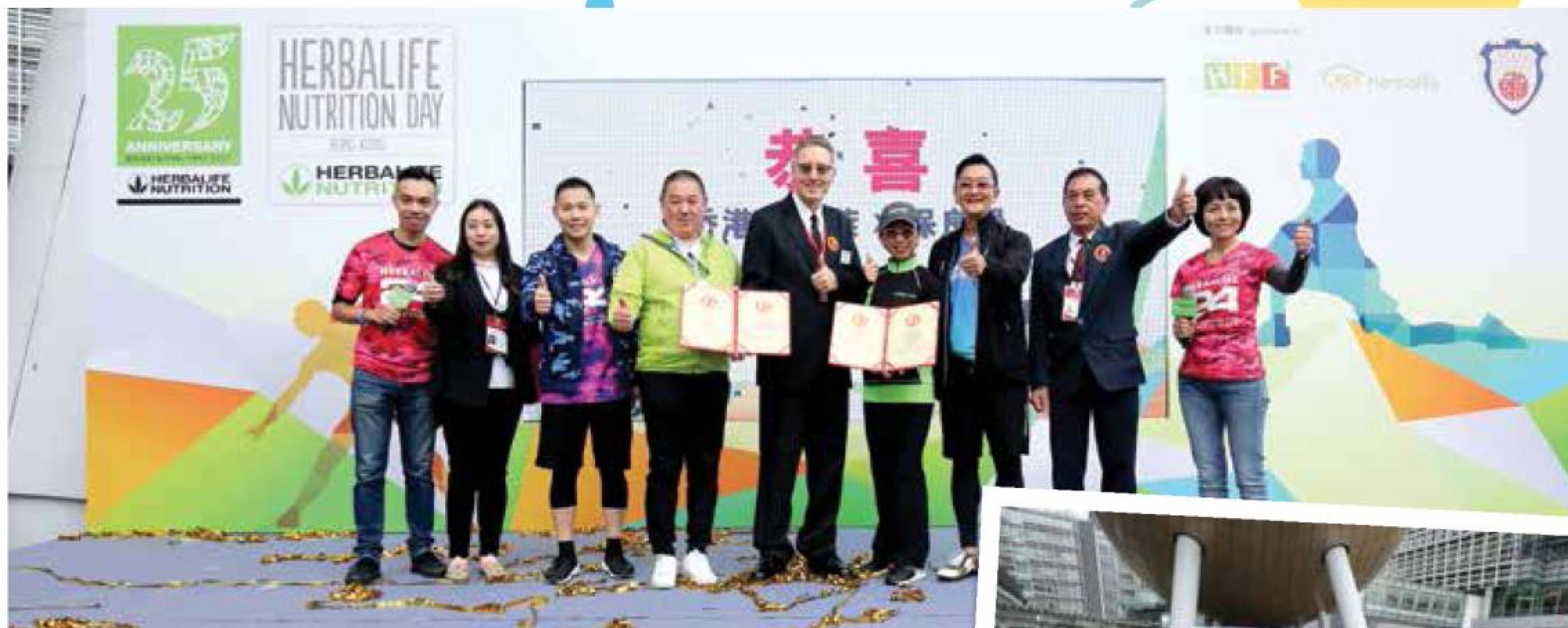
逾千名參加者在香港科學園同時啟動「一觸即動」手機應用程式，創下世界紀錄。