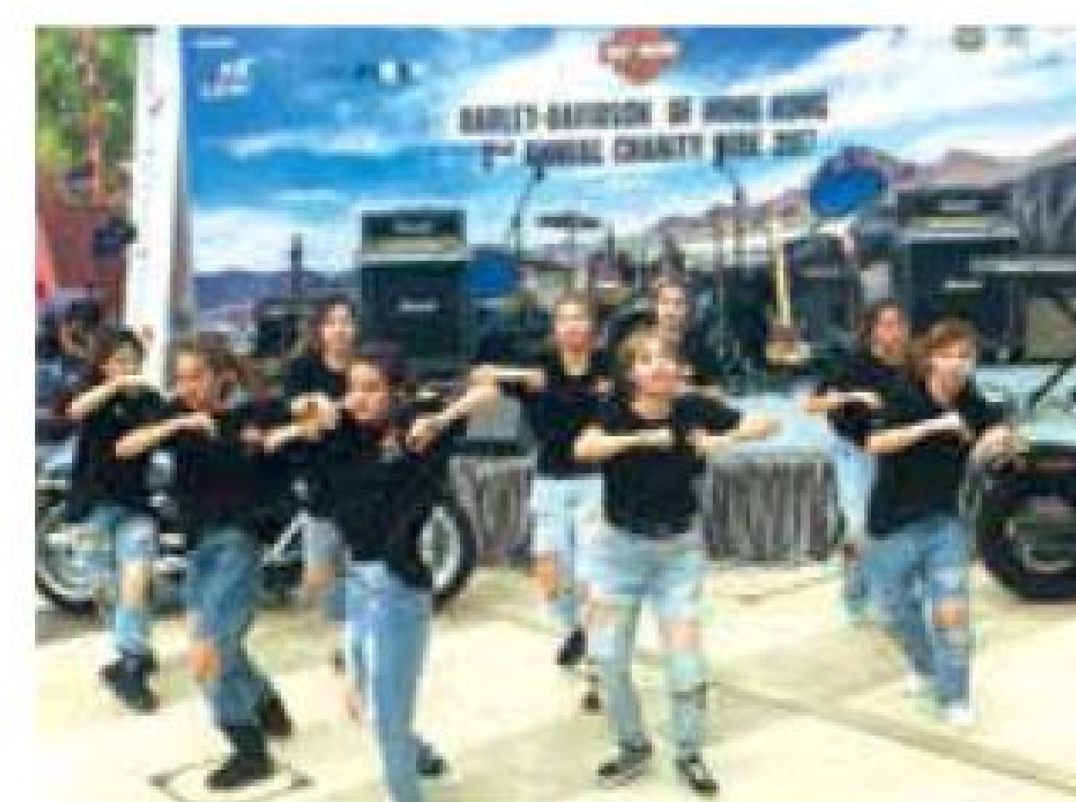
保良局曹貴子動感青年天地派出的青年舞隊,讓全場氣氛熾熱,鼓舞人生。