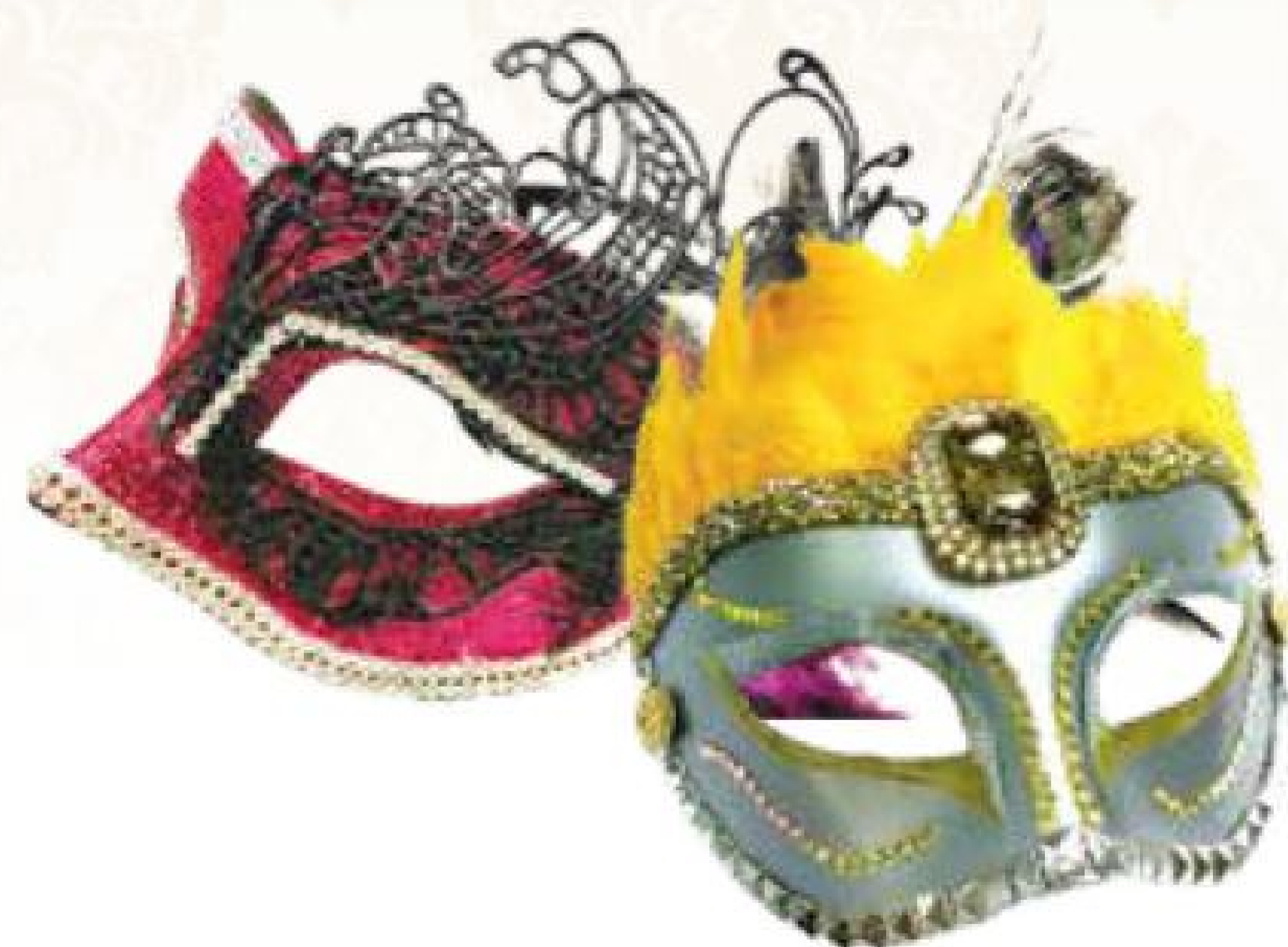
大會特設「化妝舞會面譜」慈善義賣，面譜均由保良局安老院舍人手製作，善款扣除成本用作支持本局安老服務發展。

「威尼斯之夜」慈善名酒晚宴早前圓滿舉行，是次活動以十八世紀繁華璀璨的威尼斯為主題。一眾善長嘉賓以華麗面譜登場，為本局各項服務籌募拓展經費。