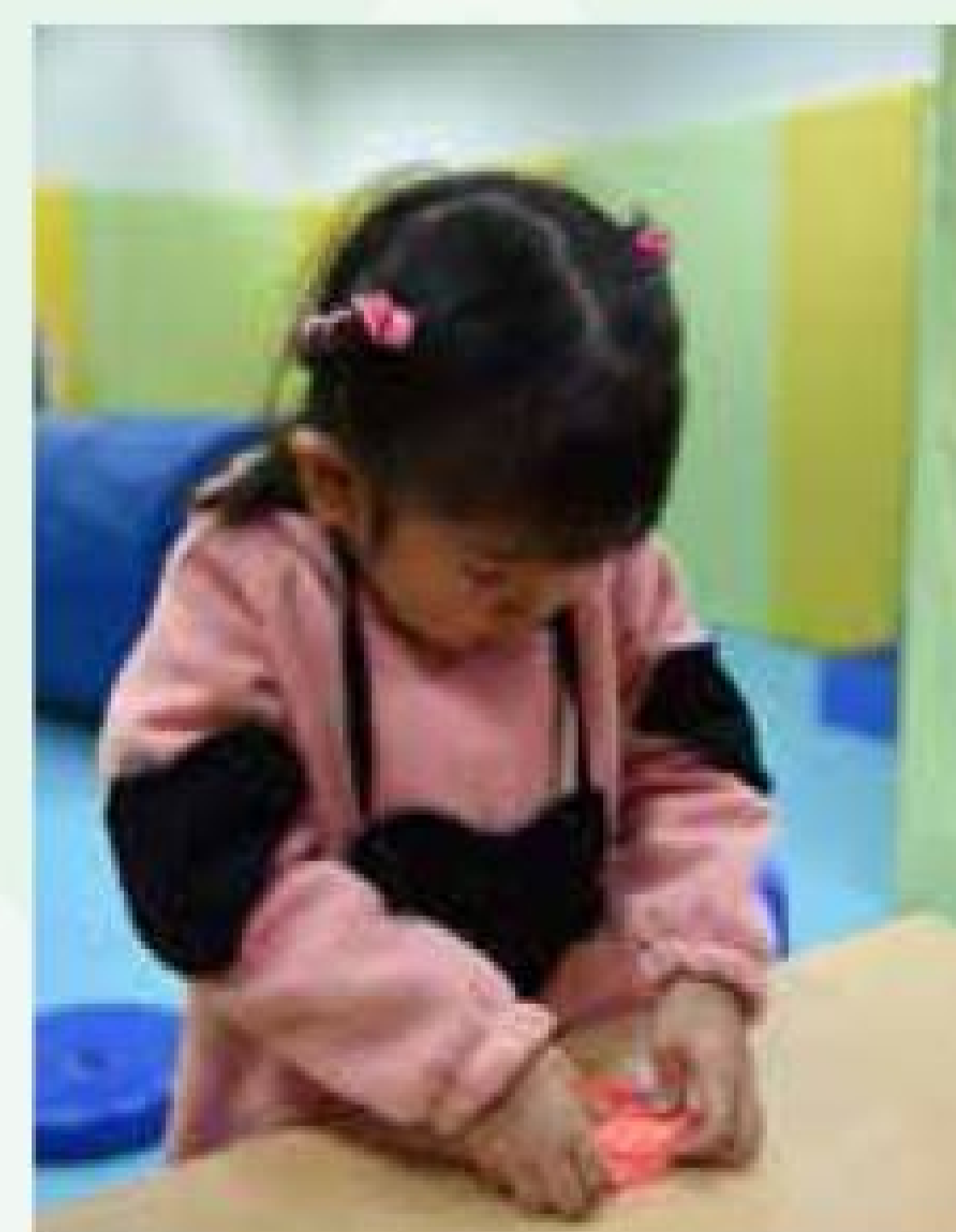
小朋友把膠粒按壓入練力膠，再拔出來，可增強小手肌。