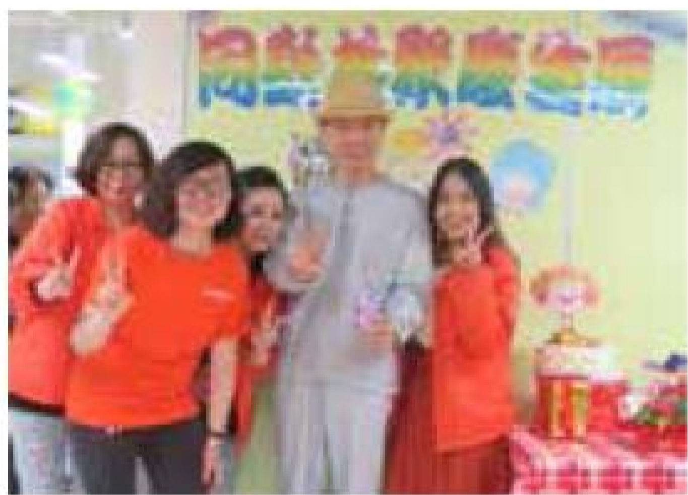
愛健樂(香港)有限公司 生日會 受惠單位：盧邱玉霜耆暉中心