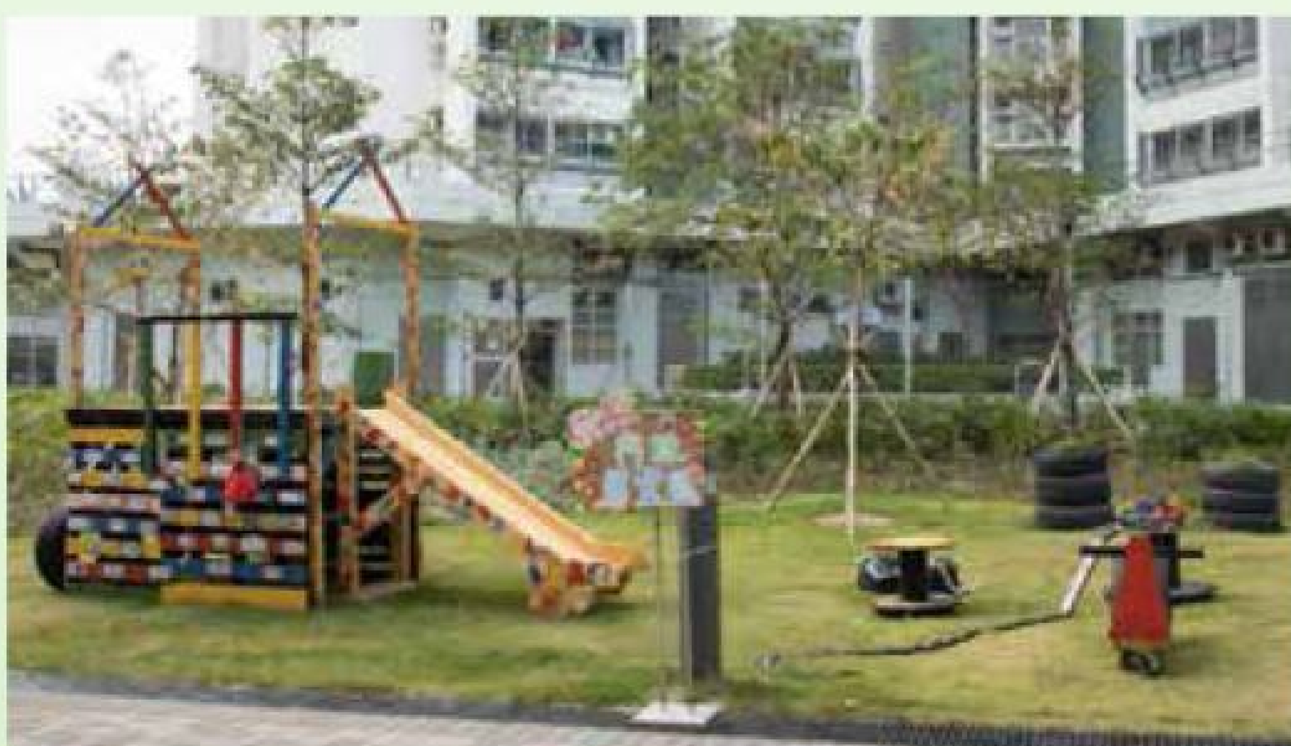
場內設有綠化休憩空間，亦有回收物料製成的互動遊戲，在社區推廣環保。

為鼓勵市民實踐綠色生活，保良局繼「綠在東區」後，推出第2個營運的環保署綠在區區計劃—「綠在深水埗」，支援社區回收及環保教育工作。「綠在深水埗」試業半年後，成功聯繫區內63個屋苑、機構及學校舉辦約140場環保教育活動，所有活動費用全免，至今超過5,000人次參加，並回收超過4,000公斤廢物。