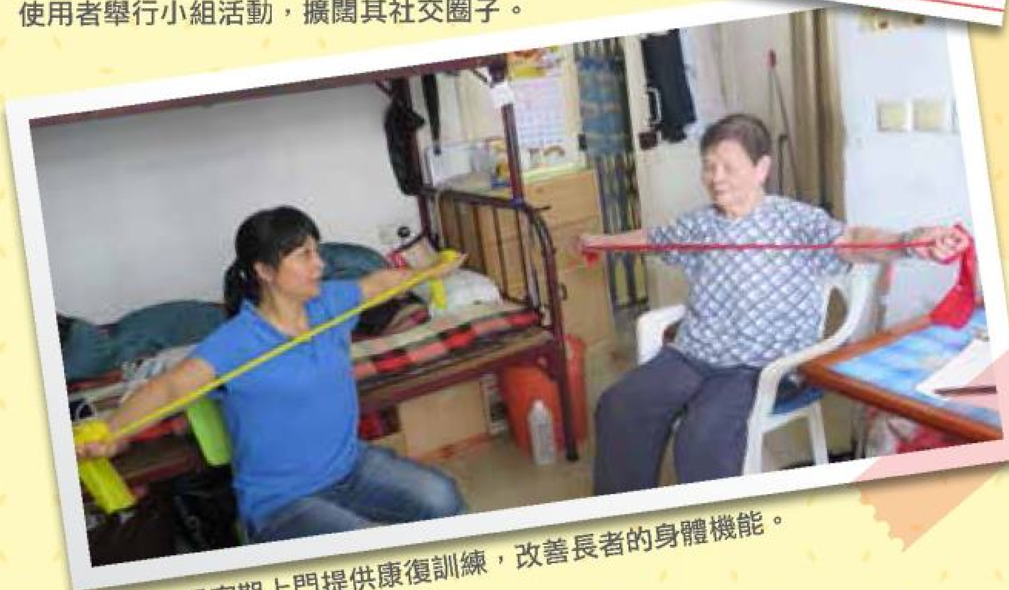
護理員定期上門提供康復訓練，改善長者的身體機能。