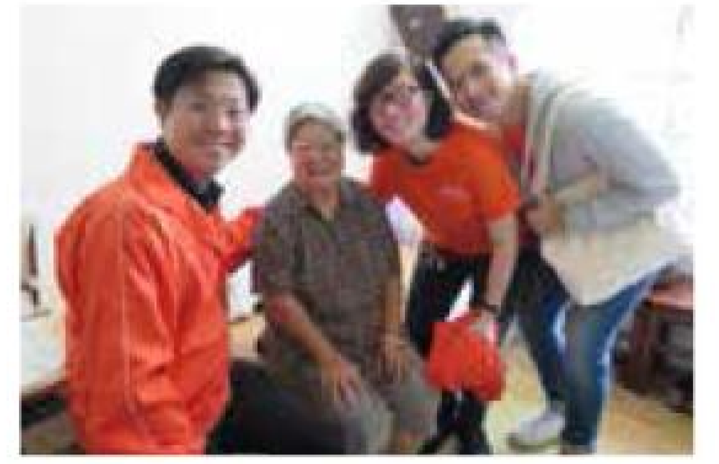
愛健樂(香港)有限公司 探訪獨居長者 受惠單位：華永會生命教育及長者支援中心