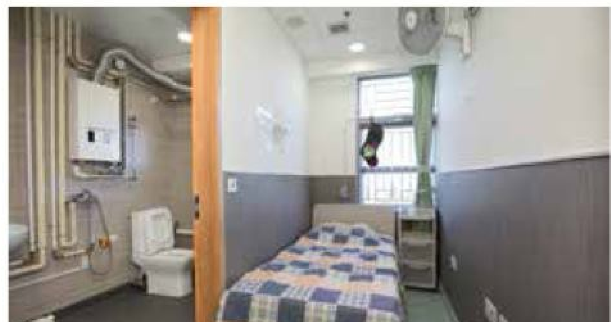
家舍有全港首設的獨立病房，以照顧患傳染病的兒童。

特色 水泉澳兒童之家內有四個家舍，雖以個別家舍模式運作，有一家之主之精神，但四家舍位處同一地方可提昇互助力(SYNERGY) 其中一個家舍設有兩個獨立病房，以照應四個家舍中患傳染病之兒童 整個家舍設共享空間「薈點」，多用途活動室及兩個悠閒角，以加強四家舍之凝聚力，亦提供空間予家人與兒童溝通及相聚