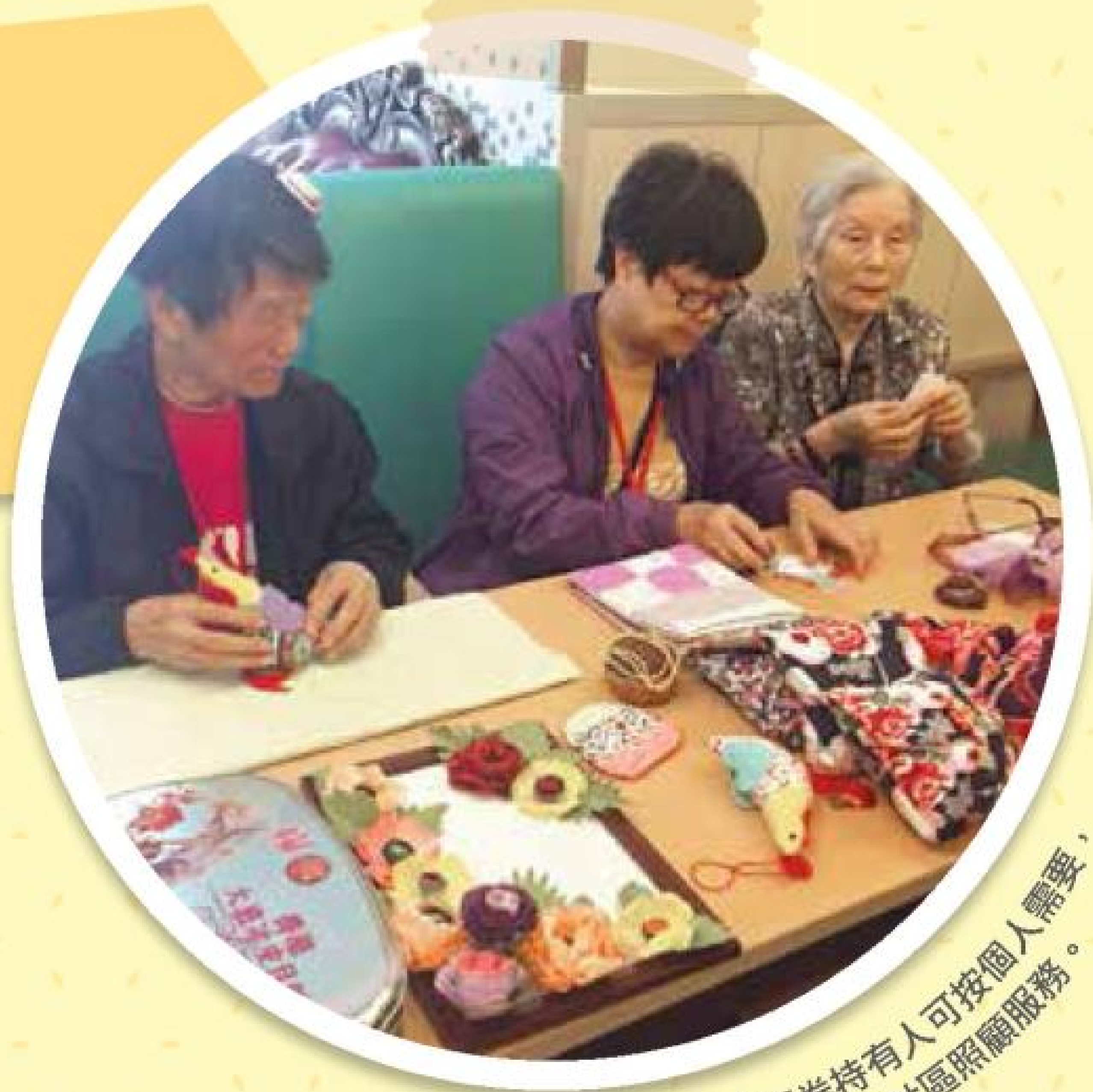
社區券持有人可按個人需要，自由選用社區照顧服務。