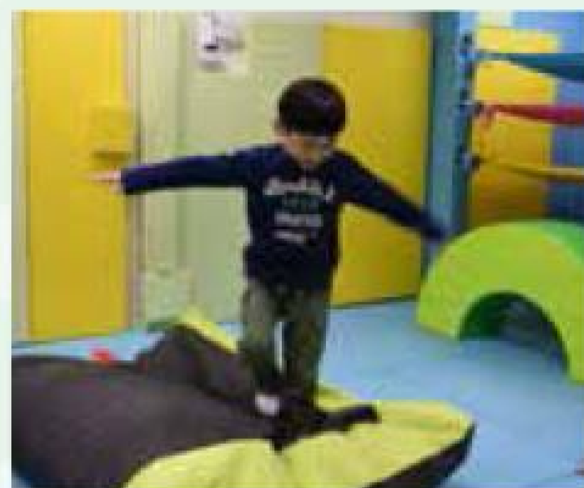
小朋友可在軟墊或平衡木行走，有助訓練平衡力或加強腳腕控制。

家長可與小朋友在家做拋接活動，指示他們將豆袋或毛公仔拋到不同距離的目標，有助訓練其距離感或控制力度。小朋友可在沙灘、軟墊等不穩定的表面行走，做平衡訓練；家長亦可帶小朋友到公園，在平衡木或石春路上步行。