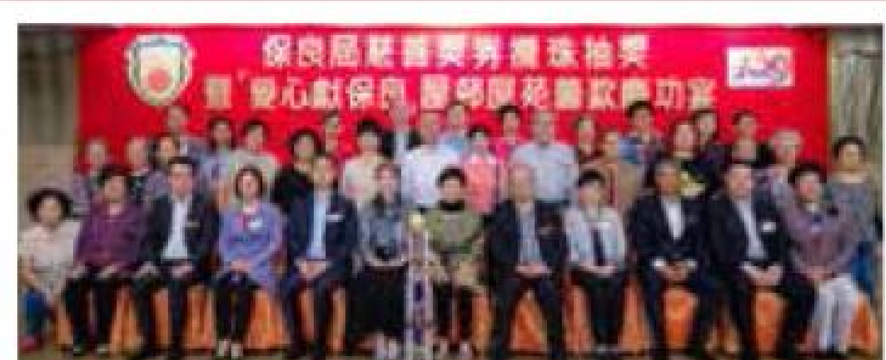
屋苑及團體組冠軍 九龍仔信福德堂