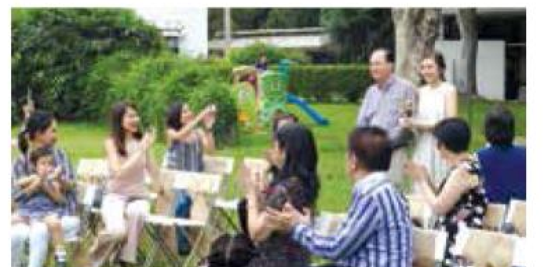
婚禮在綠草如茵的營地中央花園舉行，婚禮儀式既莊嚴又不失輕鬆。