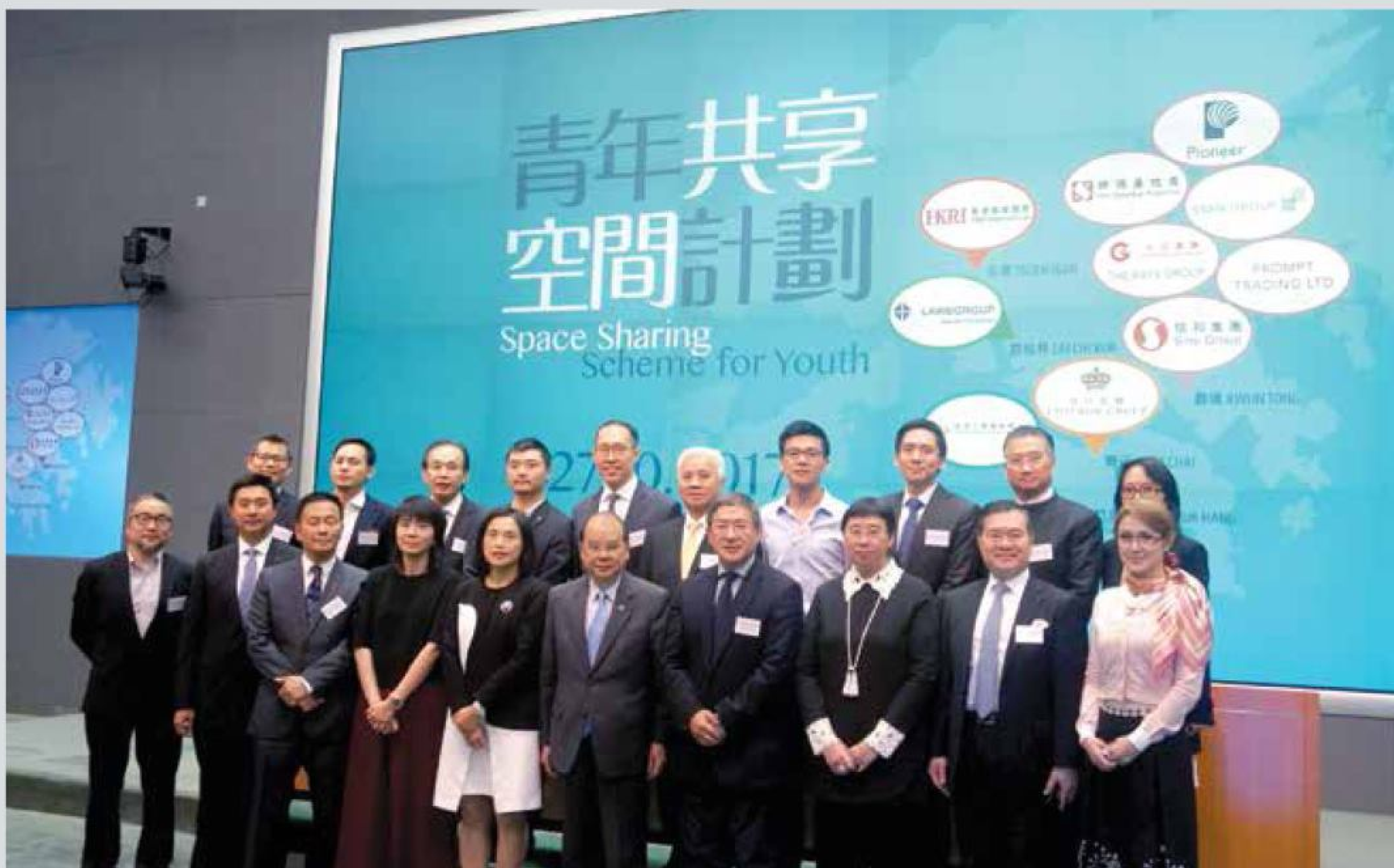
陳細潔主席(前排右一)出席早前政府舉行的「青年共享空間計劃」記者會。