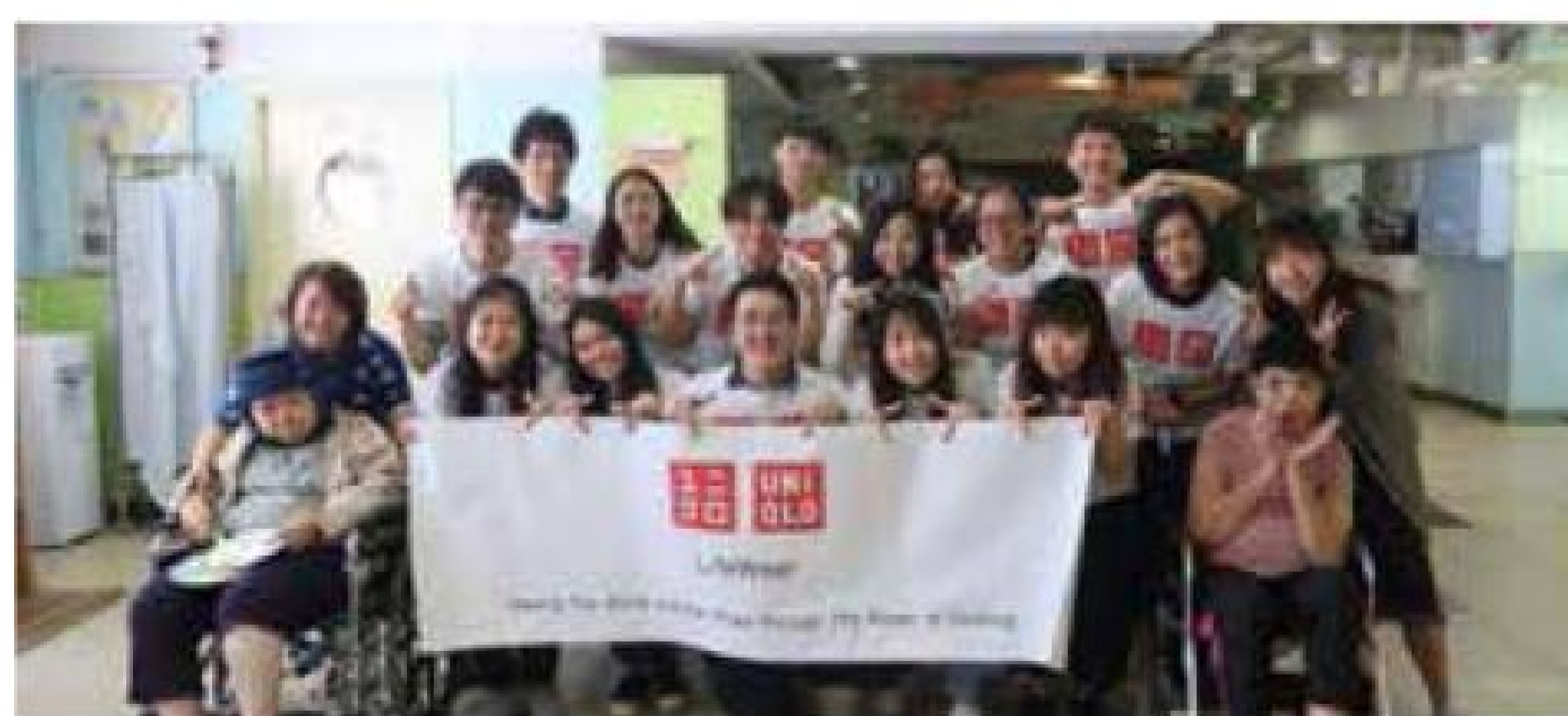
UNIQLO HONG KONG LIMITED 探訪活動