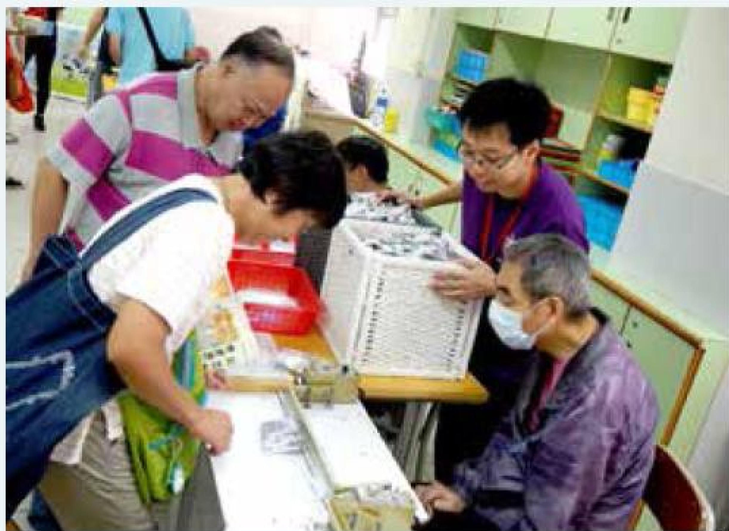
學員在中心開放日時，從旁指導參觀的市民使用封口機。