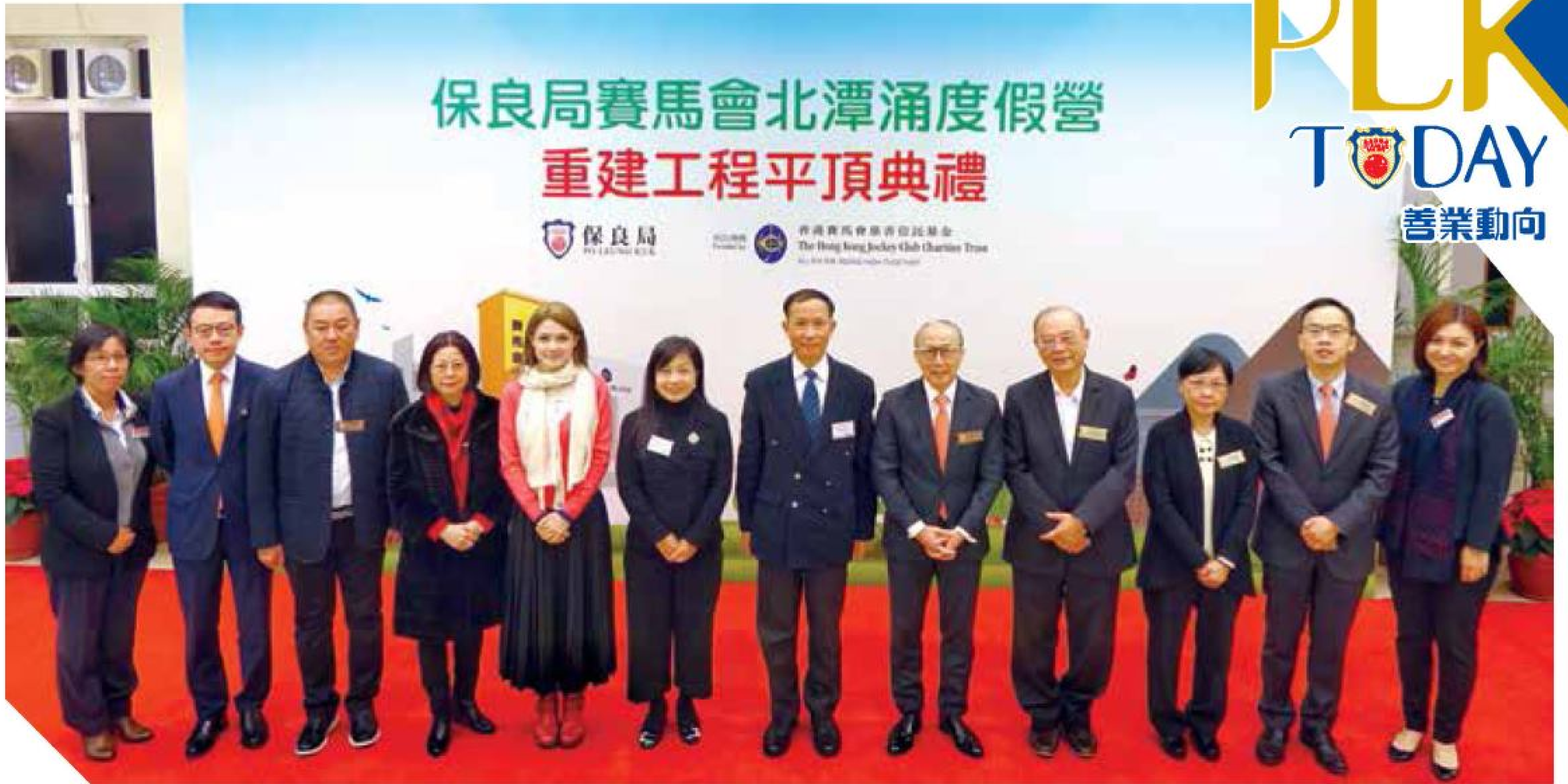
一眾主禮團嘉賓為保良局賽馬會北潭涌度假營增善工程主持平頂典禮儀式。