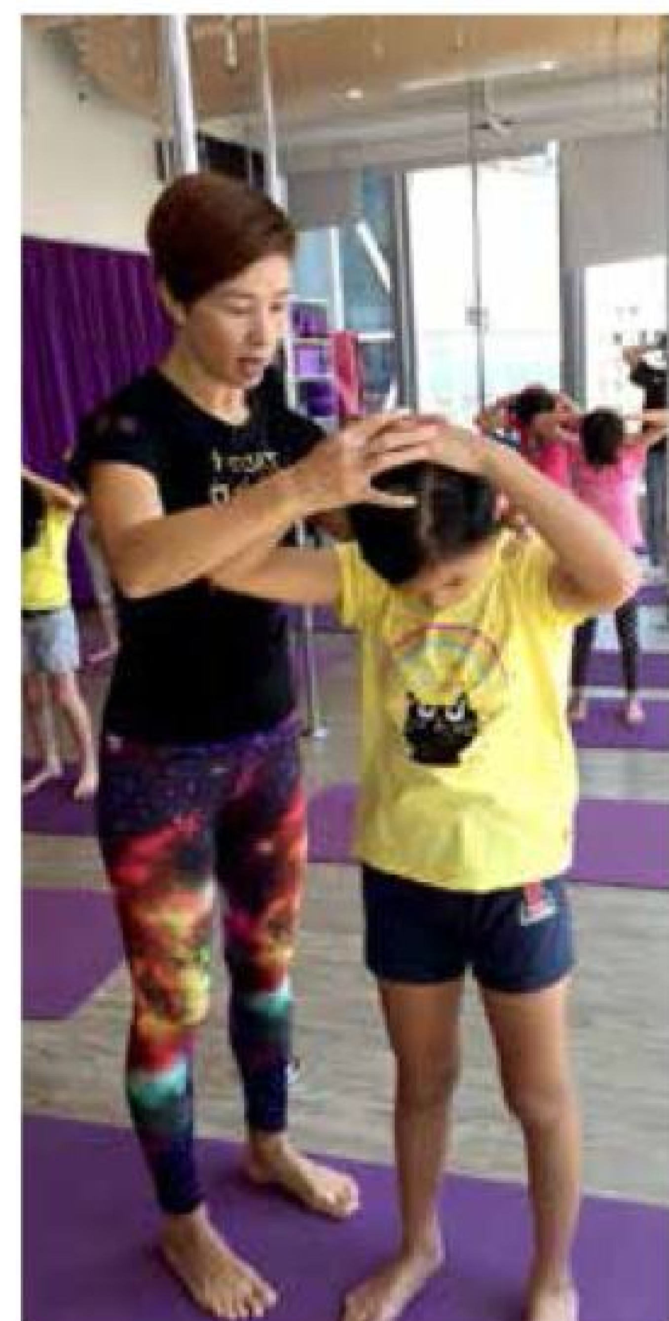
Fight Hard Fitness Fitness Class