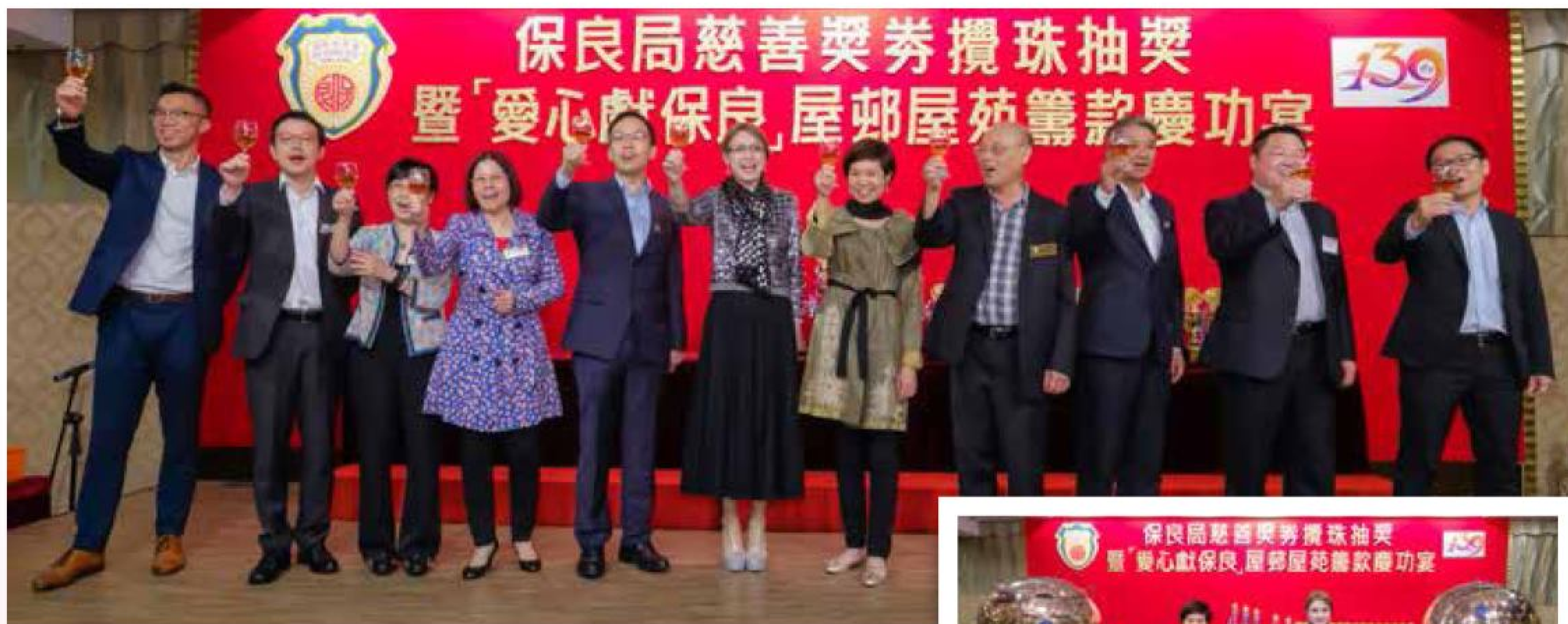
主禮人(右五)及董事會成員伉儷向全場嘉賓祝酒,多謝支持保良局。

積少成多,成就保良善業。一張慈善獎券背後,包含著義工的愛心付出,以及善長的支持信任。