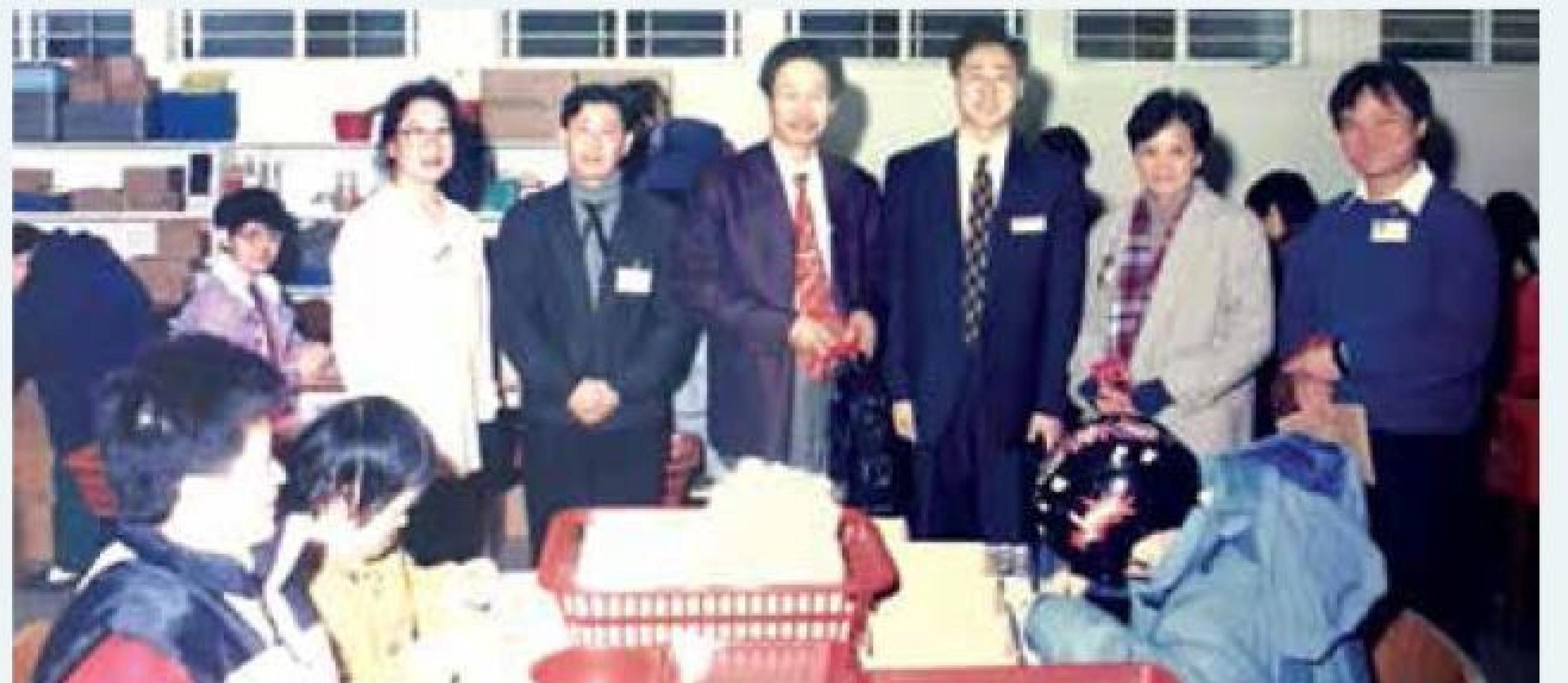
學員在太平山獅子會庇護工場工作時情況。