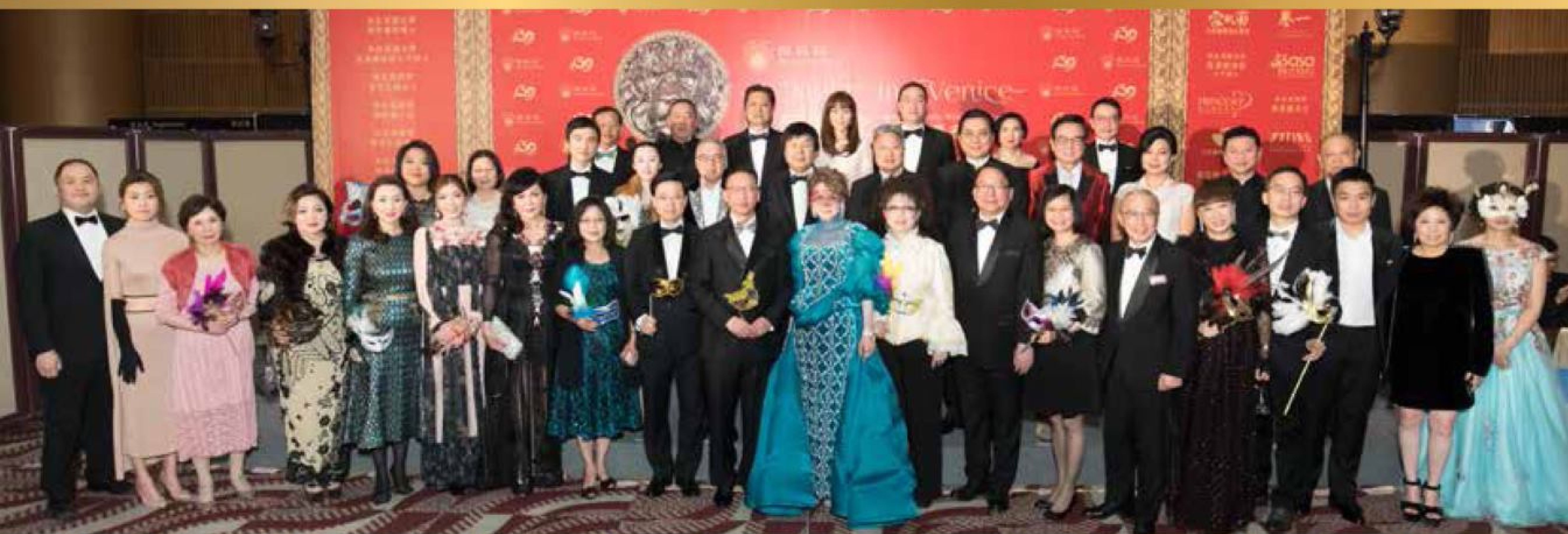
大會議禮人時任律政司司長袁國強資深大律師, GBM, SC, JP、主禮嘉賓保安局局長李家超先生, SBS, PDSM, PMSM, JP 及行政長官辦公室主任陳國基先生, SBS, IDSM, JP 聯同保良局董事會成員伉儷及節目贊助代表合照留念。