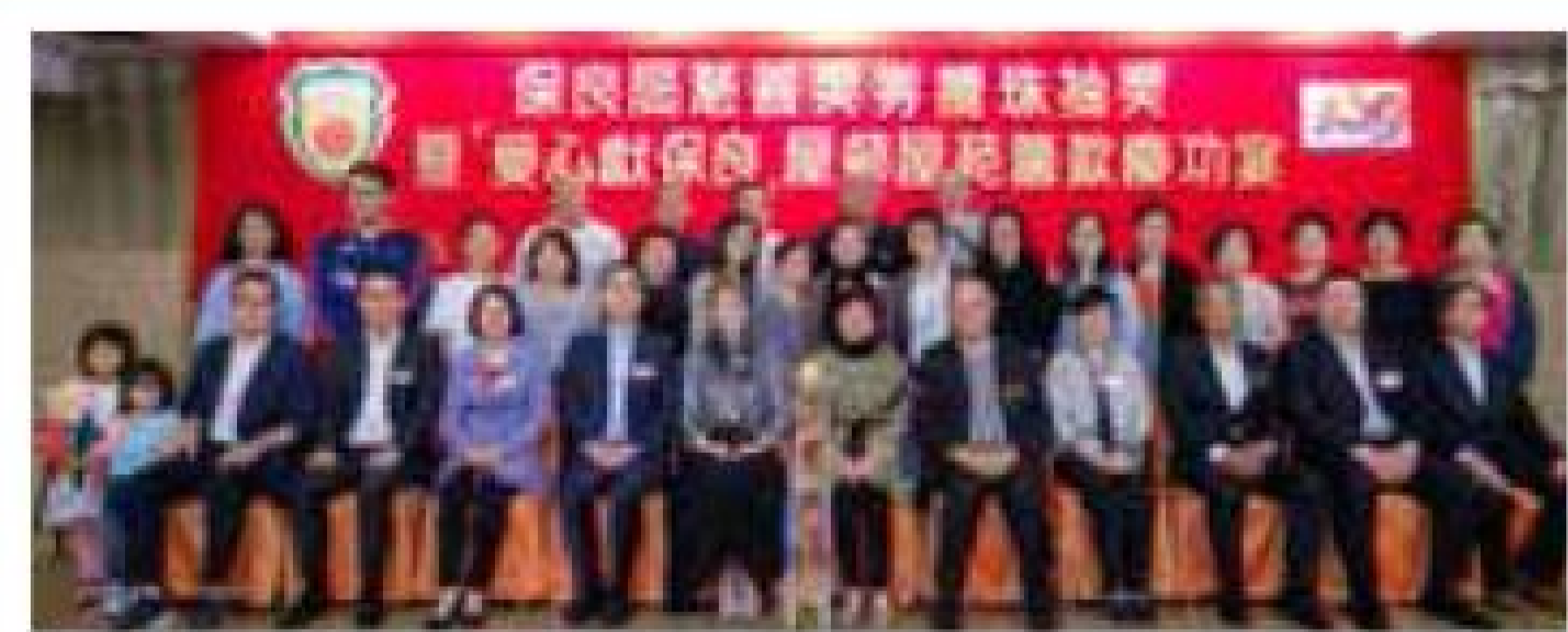
屋邨組冠軍 黃大仙下邨(一區)業主立案法團