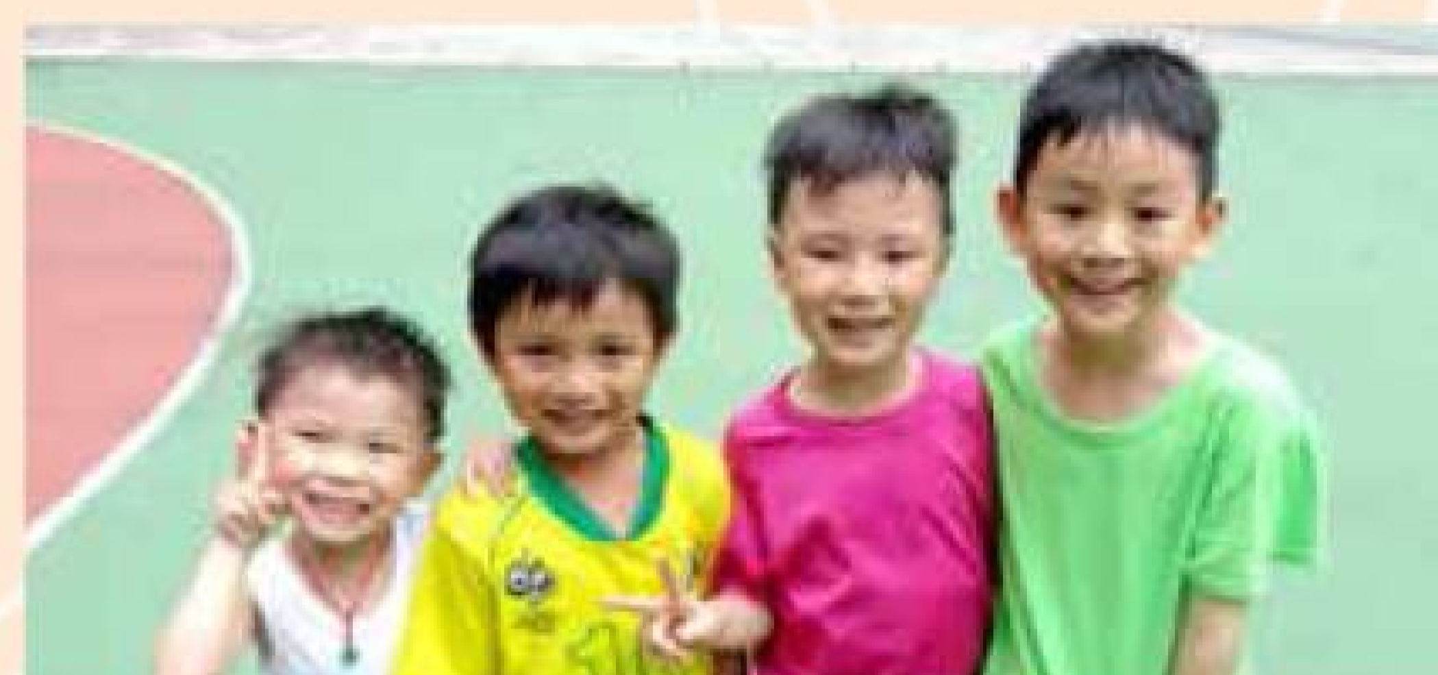
「足球小小將計劃」改善SEN兒童的社交技巧，對結交朋友大有幫助。

為推廣保良精神，本局舉辦「香港7,305日一回歸20載保良精神日」活動，鼓勵屬校學生、家長行善助人，發揮保良精神，送暖到社區。保良局屬下共41間中學、小學、幼稚園及特殊學校，逾18,000名義工積極響應，3個月內服務總時數達52,104小時。