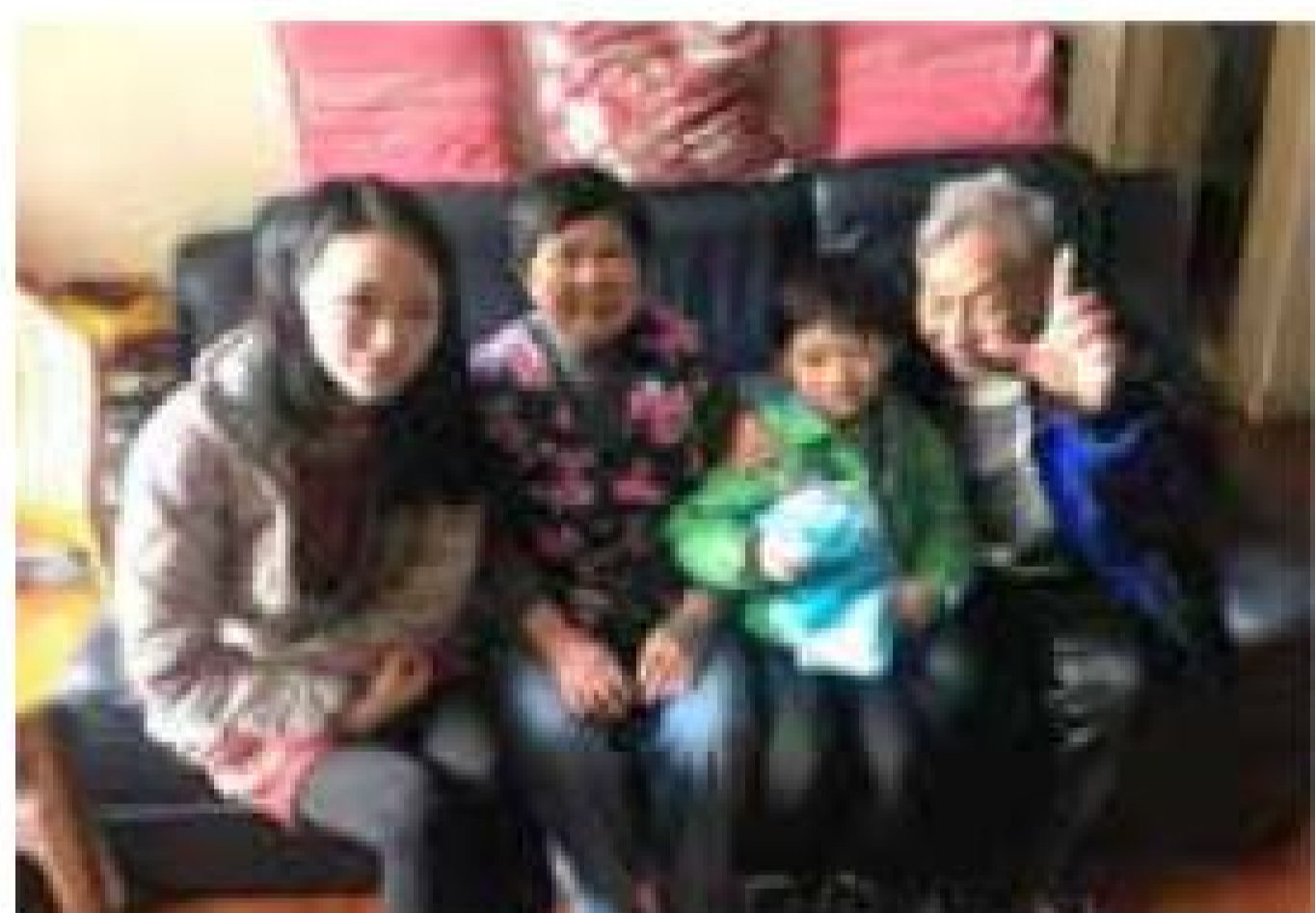
第一信用金融集團 探訪獨居長者 受惠單位：莊啟程耆暉中心