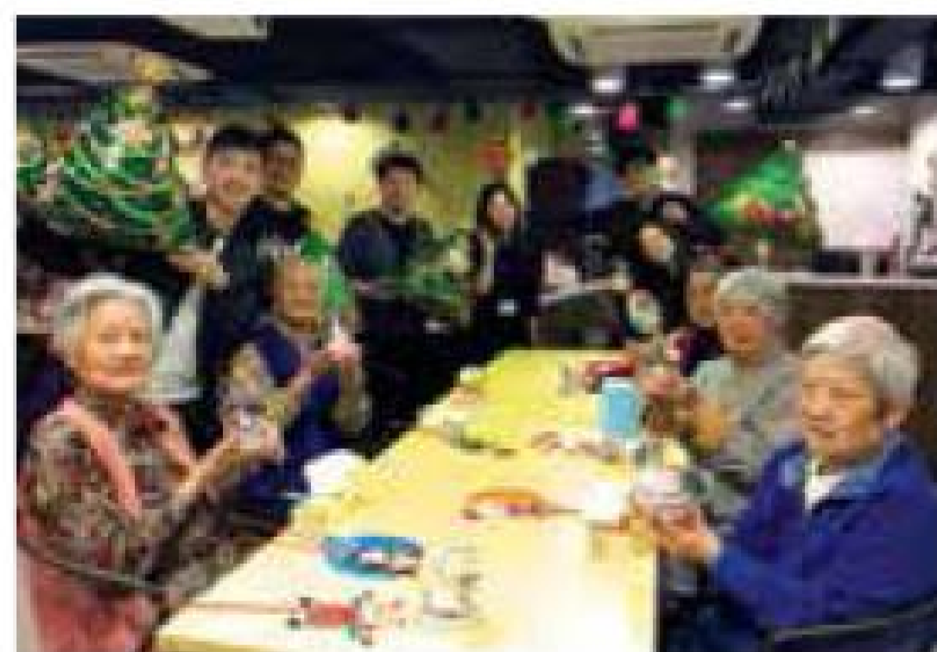
亞科視訊系統工程有限公司 製作聖誕水晶球 受惠單位：灣仔護老院暨長者日間護理中心