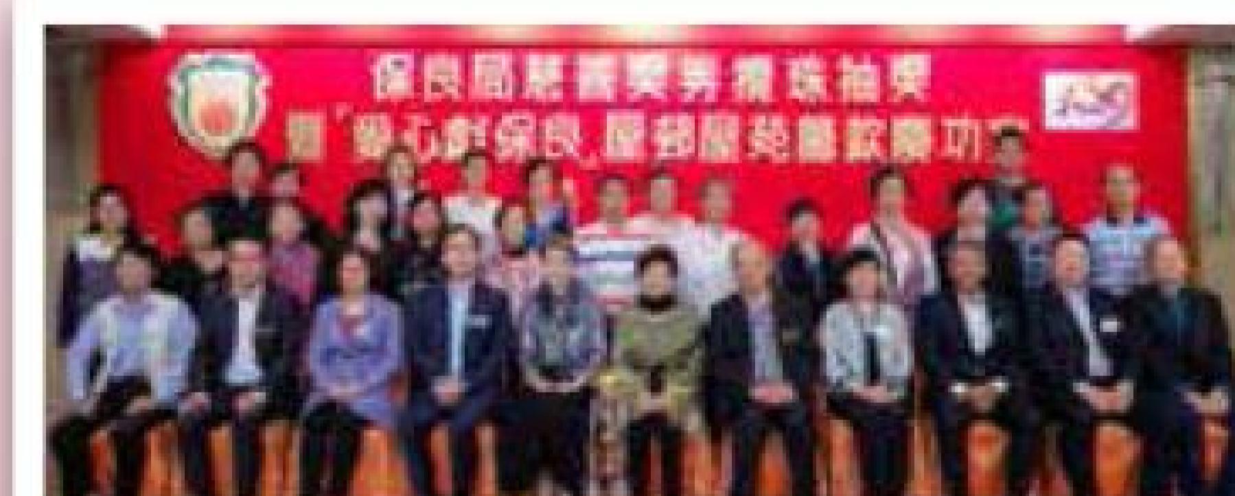
屋邨組季軍 華富邨籌款委員會