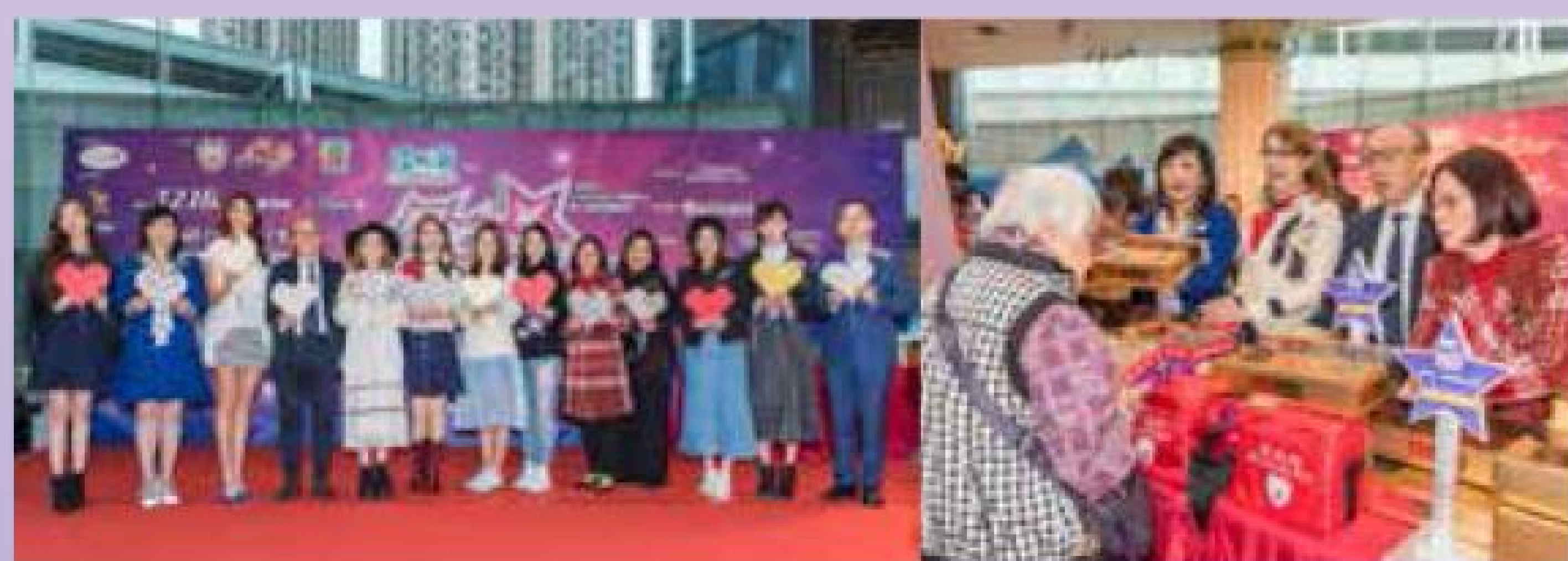
慈善義賣暨宣傳活動